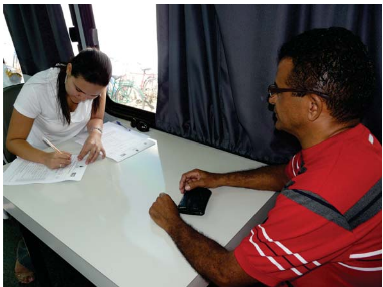
Cadastramento dos reeducandos da Cadeia Pública no projeto Começar de Novo.

Em 2010, o SENAI qualificou 21 reeducandos da Cadeia Pública, nos cursos de Pintor e Pedreiro assentador de tijolos.