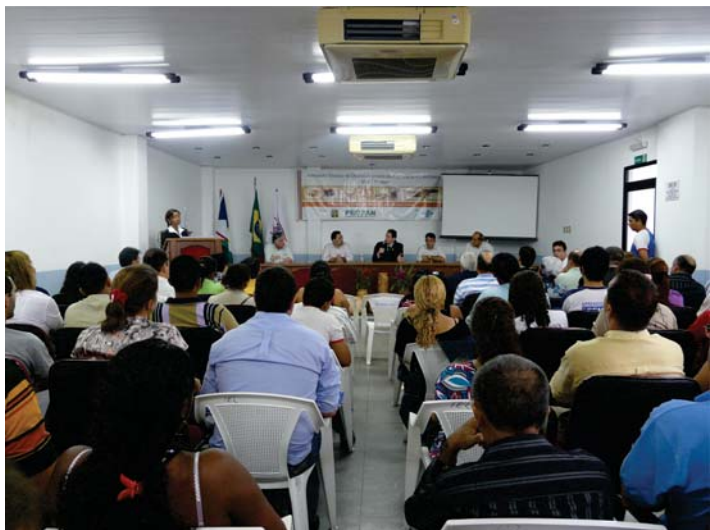
Empresários da panificação, estudantes e representantes do setor no I Seminário de Panificação promovido pelo SINDIPAN.

Pedrosa fez uma explanação sobre a atuação da associação, ressaltando que um dos objetivos da ABIP é levar o desenvolvimento do setor a todos os Estados do Brasil.