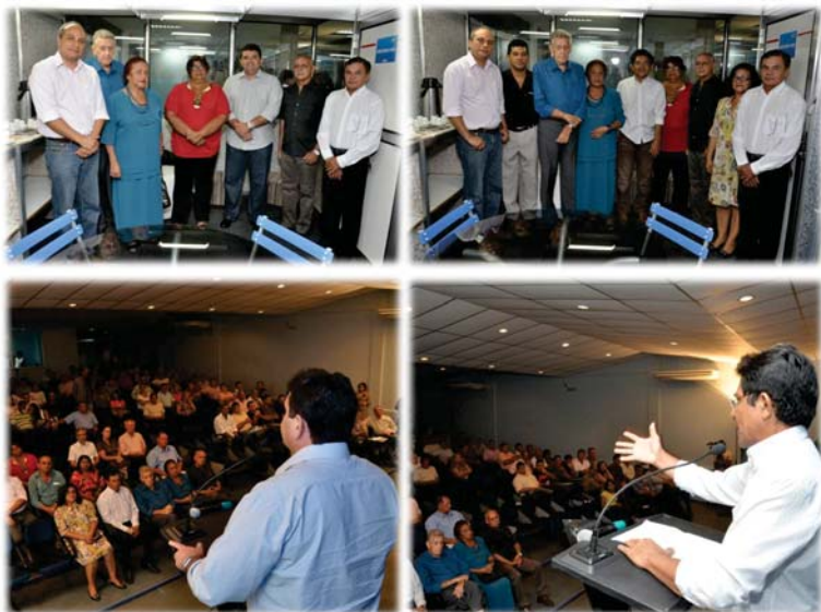
Diretoria com os candidatos a governo de Roraima e o momento da explanação das propostas de governo.

A FIER apresentou proposta de ser o órgão consultivo junto ao próximo governo, para definição de estratégias, planejamento e ações voltadas ao desenvolvimento industrial. Os candidatos aceitaram e assumiram este compromisso, pois a entidade tem forte atuação e representação junto aos sindicatos e empresas nos diferentes segmentos da indústria local.