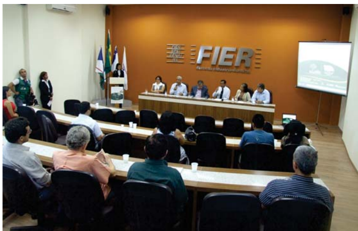
Reunião de lançamento dos Prêmios Samuel Benchimol e Banco da Amazônia de Empreendedorismo Consciente no auditório da FIER.

A premiação, realizada na Federação das Indústrias do Estado do Amazonas, homenageou os 50 anos de fundação da entidade.