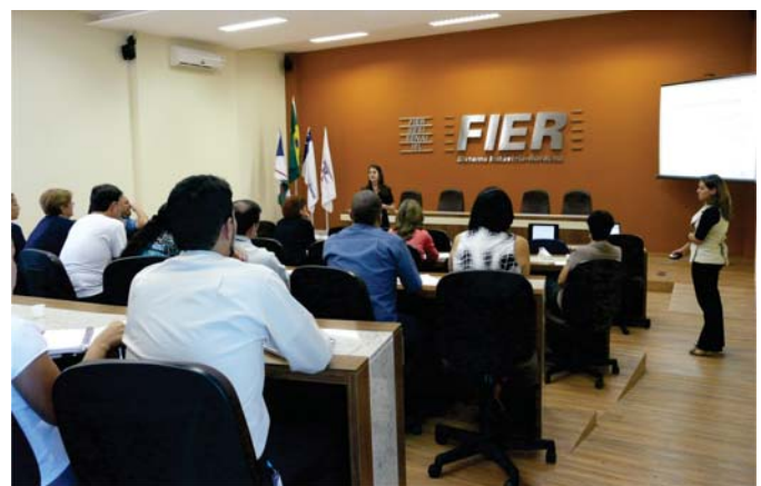
Reunião de alinhamento e atendimento das demandas do Sistema Indústria/RR

Na ocasião foram apresentados os mapas estratégicos e o modelo de marketing corporativo. Também foi construído e validado o cronograma de trabalho com a equipe técnica do Sistema Indústria Roraima para o atendimento às demandas.