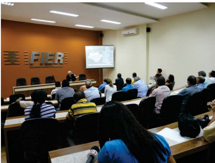
Apresentação do projeto Norte Competitivo para Conselheiros, Diretores e Dirigentes do Sistema Indústria Roraima

A Federação das Indústrias do Estado de Roraima - FIER lançou no dia 07 de dezembro, o Projeto Norte Competitivo no Estado, que tem por finalidade a implantação de uma infraestrutura logística, englobando todos os modais de transportes (ferrovias, hidrovias, rodovias e portos).