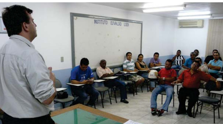
Procompi: Reunião com o setor mineral

Resultado de uma parceria entre a Confederação Nacional da Indústria (CNI) e o Serviço Brasileiro de Apoio às Micro e Pequenas Empresas (SEBRAE/DN), o Programa de apoio à Competitividade das Micro e Pequenas Indústrias - PROCOMPI, conta com o apoio de projetos concebidos pela Federação das Indústrias do Estado de Roraima, em parceria com a unidade regional do SEBRAE, empresas e