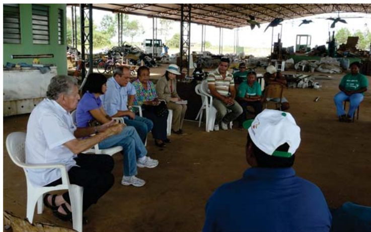
Visita dos membros do CTMAR à Cooperativa UNIRENDA

O projeto foi proposto pelo Conselho Temático de Meio Ambiente, Recursos Naturais, Infraestrutura e Energia - CTMAR, implantado pela FIER, com o objetivo de incentivar a coleta seletiva em Boa Vista, por meio dos Pontos de Entrega Voluntária de Resíduos Sólidos (PEVs), e criar condições para a geração de renda e oportunidade aos trabalhadores da Cooperativa Catadores e Recicladores de Resíduos Sólidos do Estado de Roraima - UNIRENDA.