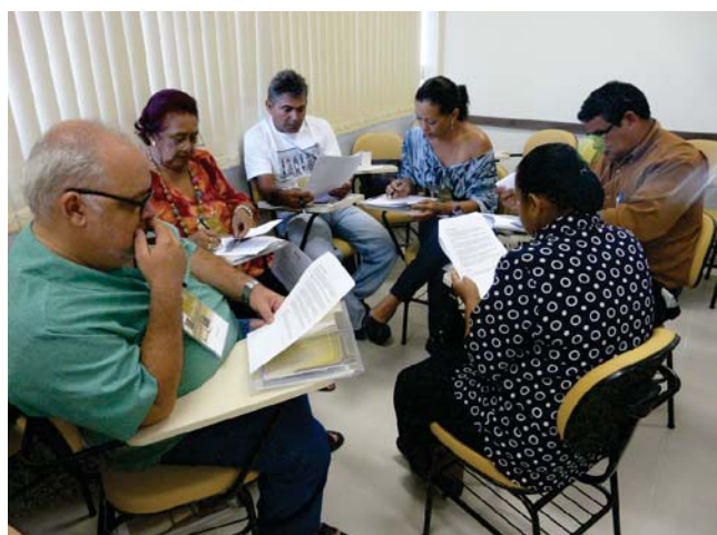
Durante os módulos do PDA os participantes realizam tarefas para apresentá-las ao grupo.