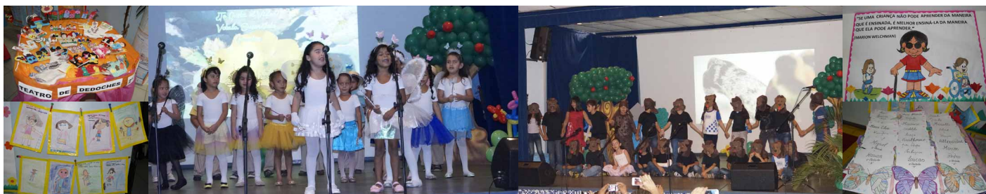
Alunos encantam pais e convidados na Jornada de Literatura 2014

Para mostrar os resultados dos trabalhos de incentivo à leitura durante todo o ano letivo, o Centro de Educação do Trabalhador João de Mendonça Furtado, realizou nos dias 30 e 31 de outubro, a Jornada de Literatura 2014.