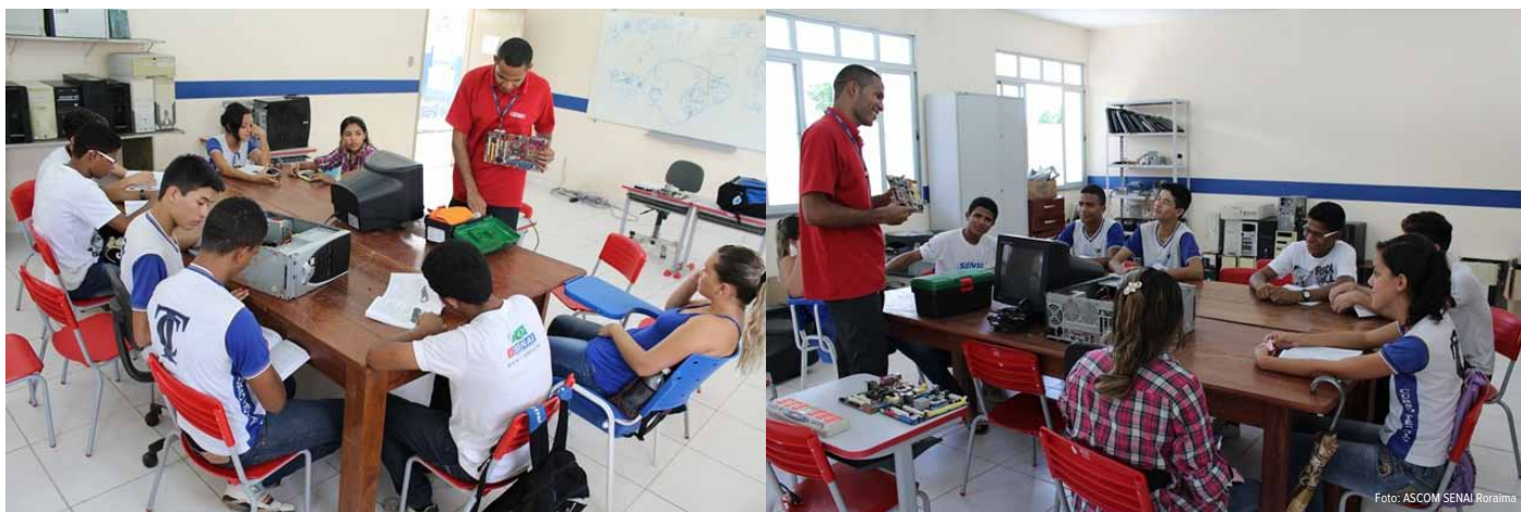
O SENAI qualifica mais 500 alunos da rede pública estadual na escola Major Alcides

Nos meses de setembro e outubro o SENAI Roraima realizou 20 cursos nas áreas de informática e gestão, distribuídos nas modalidades de Qualificação, Aperfeiçoamento e Especialização Profissional, atendendo a 546 alunos e docentes da escola estadual Major Alcides Rodrigues dos Santos.