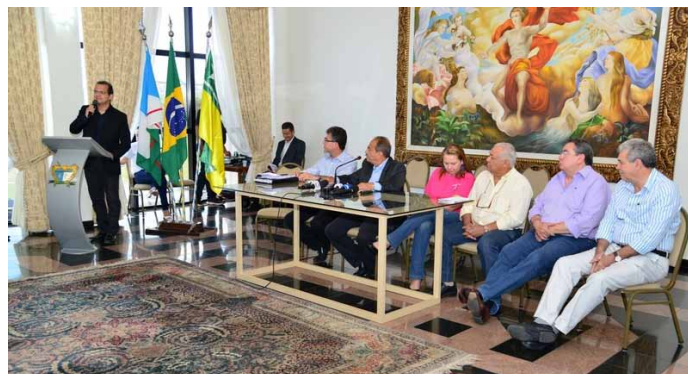
Coletiva onde o governador Chico Rodrigues anunciou o aumento do sublimite do simples para 1,8 milhões de reais

Quando um Estado cria o sublimite, que no caso de Roraima agora abrange as empresas que têm faturamento até R$ 1.800.000,00, é possível incluir neste rol também o ICMS e o ISS.