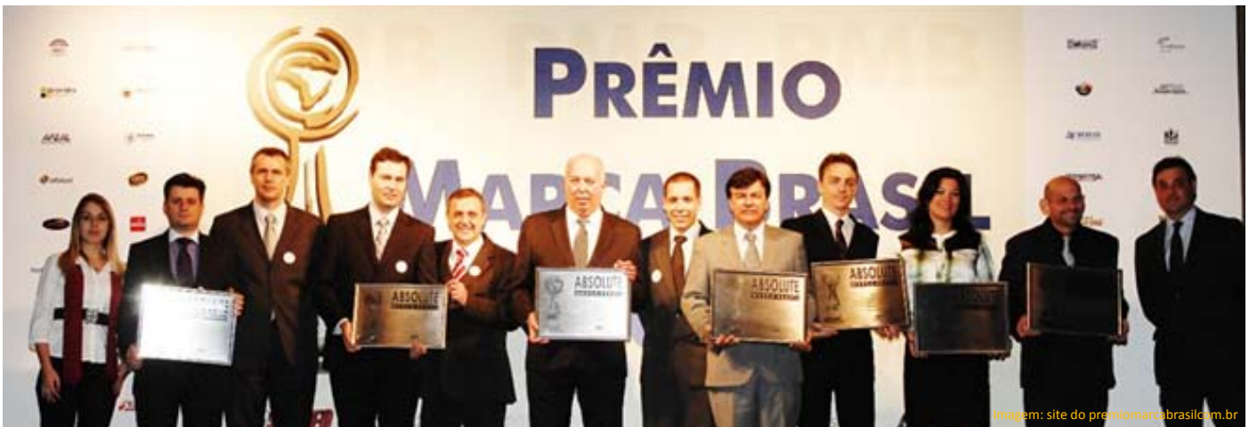
SESI será condecorado no dia 15 de setembro, em duas categorias: Top Max e Top Absolute Marca Brasil

SESI será premiado pelo 9º ano consecutivo no Prêmio Marca Brasil pelos serviços de segurança e saúde no trabalho