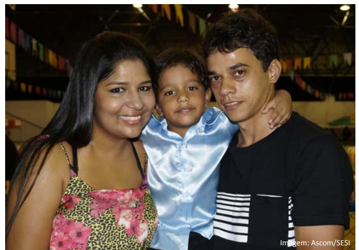
Apresentação da cantiga Samba Lelê do 1º e 2º Ano