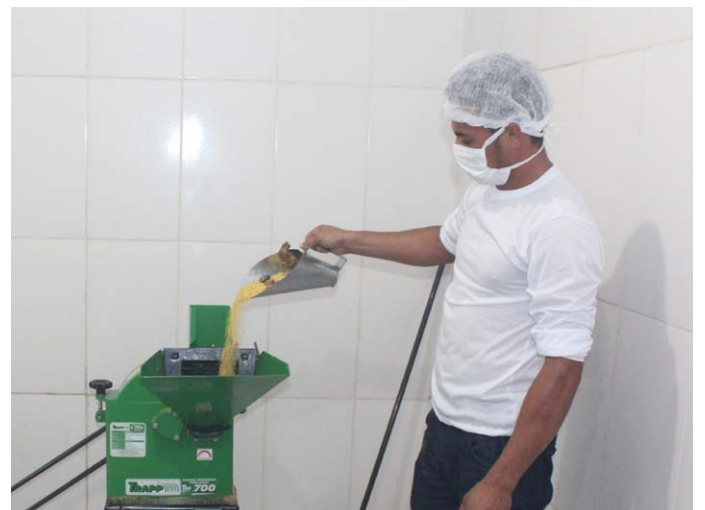
Redução de desperdícios no processo produtivo é o foco do Programa Brasil mais Produtivo

O Programa Brasil Mais Produtivo (B+P) é uma iniciativa do governo federal, coordenada pelo Ministério da Indústria, Comércio Exterior e Serviços (MDIC) e realizada pelo Serviço Nacional de Aprendizagem Industrial (SENAI), ABDI e Agência Brasileira de Promoção de Exportações e Investimentos (Apex-Brasil), com a parceria do Serviço Brasileiro de Apoio às Micro e Pequenas Empresas (Sebrae) e apoio do Banco Nacional de Desenvolvimento Econômico e Social (BNDES).