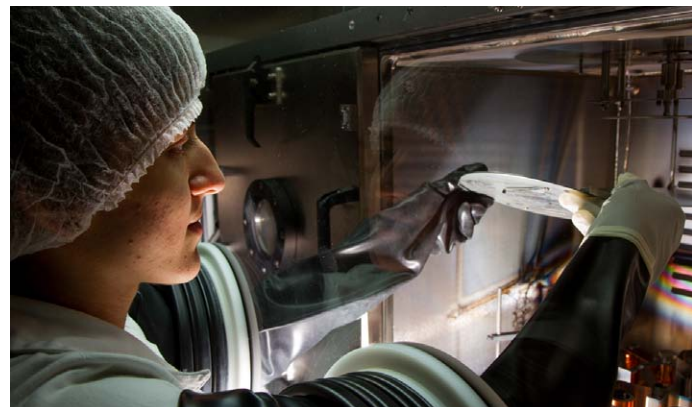
As inscrições para o Prêmio Mercosul de Ciência e Tecnologia encerram dia 2 de março de 2018.

Instituído em 1998 pela Reunião Especializada em Ciência e Tecnologia do Mercosul (RECYT), o objetivo do prêmio é reconhecer os melhores trabalhos de estudantes, jovens pesquisadores e equipes de pesquisa, que representem potencial contribuição para o desenvolvimento científico e tecnológico e incentivar a realização de pesquisa