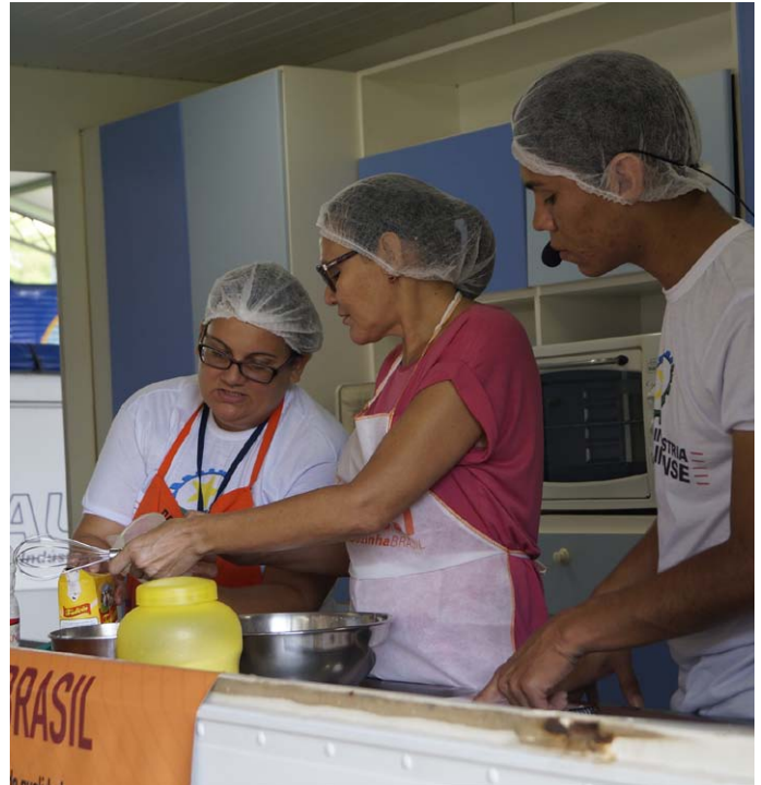
Curso será aberto para a comunidade em geral.

A capacitação será aberta para a comunidade, mas, as vagas são limitadas, portanto os interessados em participar, devem chegar meia hora antes para preencher a ficha de inscrição. Os documentos necessários são originais do RG ou CPF e, se for trabalhador o CNPJ da empresa. Para mais informações o telefone para contato é 4009-1835.