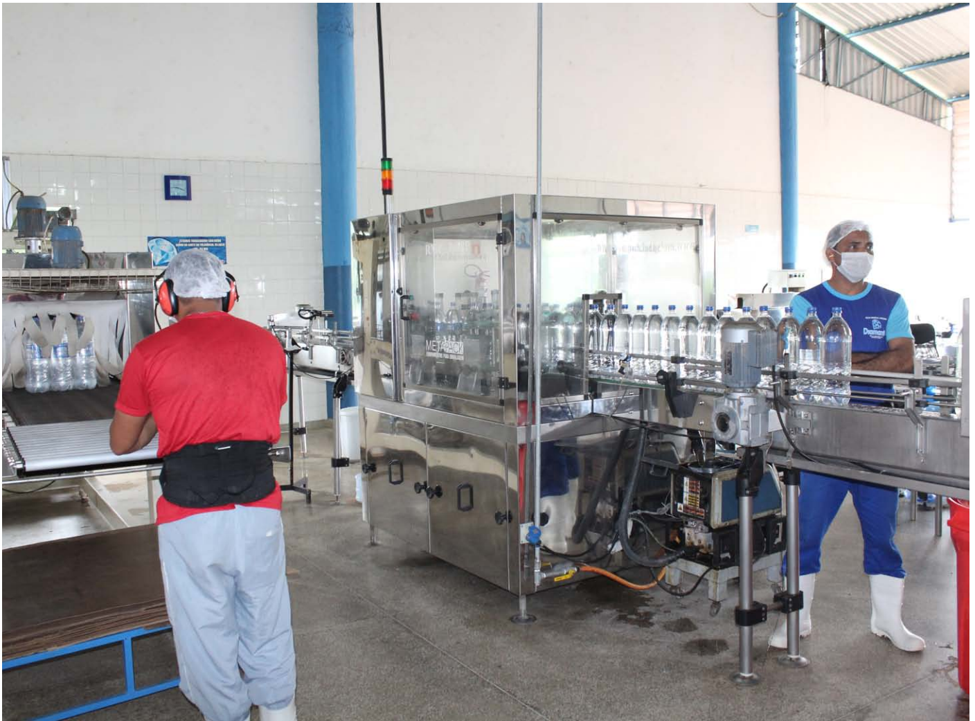
Água Diamante foi uma das empresas participantes

As empresas que tiveram atendimento concluído até agora pelo Programa Brasil Mais Produtivo, em Roraima, tiveram um aumento médio de 66% da produtividade. Os resultados mostram o sucesso da iniciativa, cuja meta inicial era aumentar em 20% a produtividade das indústrias com a promoção de melhorias rápidas, de baixo custo e alto impacto.