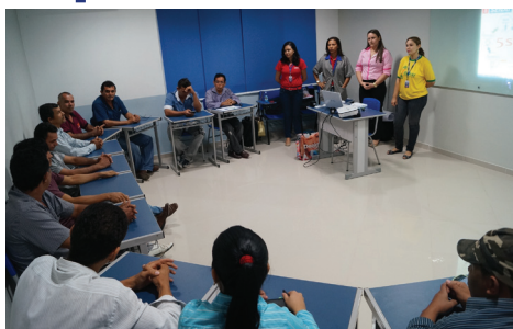
Metodologia 5 S visa facilitar a organização das atividades nas empresas