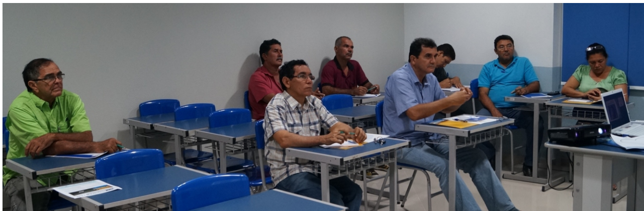
Procompi moveleiro debateu a sustentabilidade e o associativismo.

Uma parceria entre a Federação das Indústrias de Roraima – FIER e o SENAI, no âmbito do Programa de Apoio à Competitividade da Micro e Pequena Indústria - PROCOMPI, proporcionou a realização de um workshop abordando o tema Associativismo e Sustentabilidade Ambiental. Oito empresários do setor moveleiro estiveram presentes na atividade.