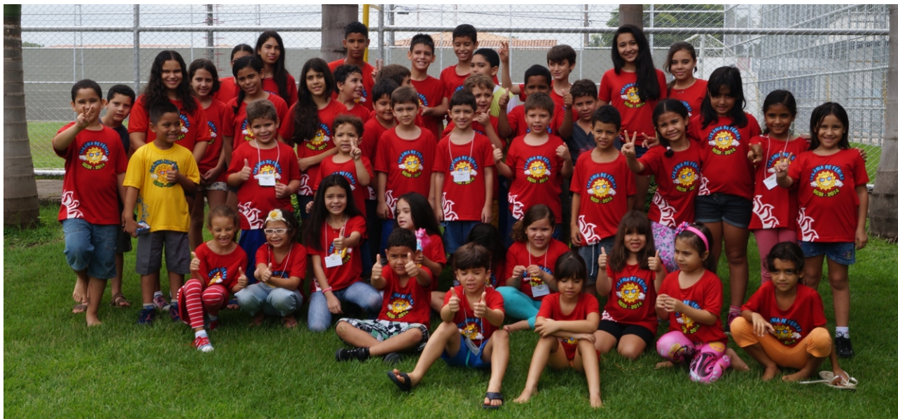
Crianças se divertem na primeira semana da colônia de férias.

Inscrições continuam abertas apara a próxima semana