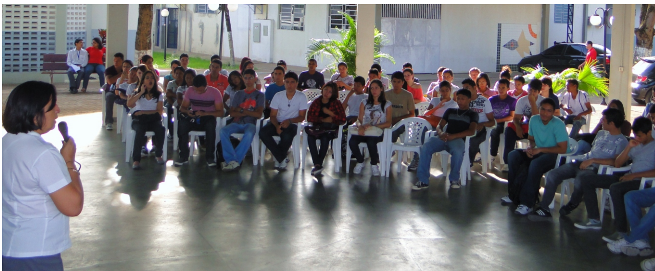
Início das aulas da Modalidade de Aprendizagem Industrial.

O SENAI receberá 300 novos aprendizes distribuídos nos cursos de Auxiliar Administrativo, Auxiliar Administrativo na Construção Civil, Auxiliar de Edificações, Auxiliar Técnico Eletrônico, Costureiro Industrial, Eletricista Industrial, Mecânico de Manutenção de Automóvel, Operador de Microcomputador e Padeiro e Confeiteiro. As aulas iniciam no dia 14 de julho, nos turnos matutino e vespertino.