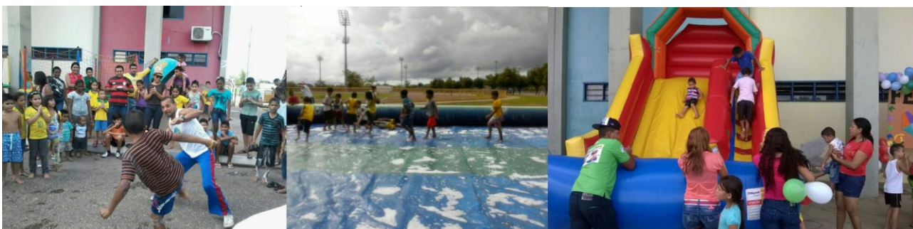
Muito lazer e diversão para as crianças do PAF na Vila Olímpica.

Em sua quinta edição, o Festival Junino do Programa Atleta do Futuro Movimentou a Vila Olímpica Roberto Marinho, no último sábado (5). Cerca de 600 crianças se divertiram em um dia de lazer e brincadeiras.