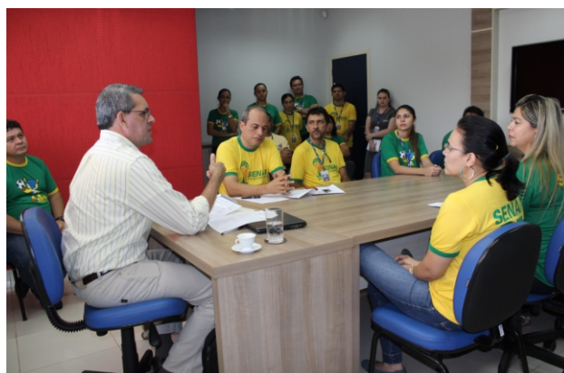
Auditoria de Manutenção.