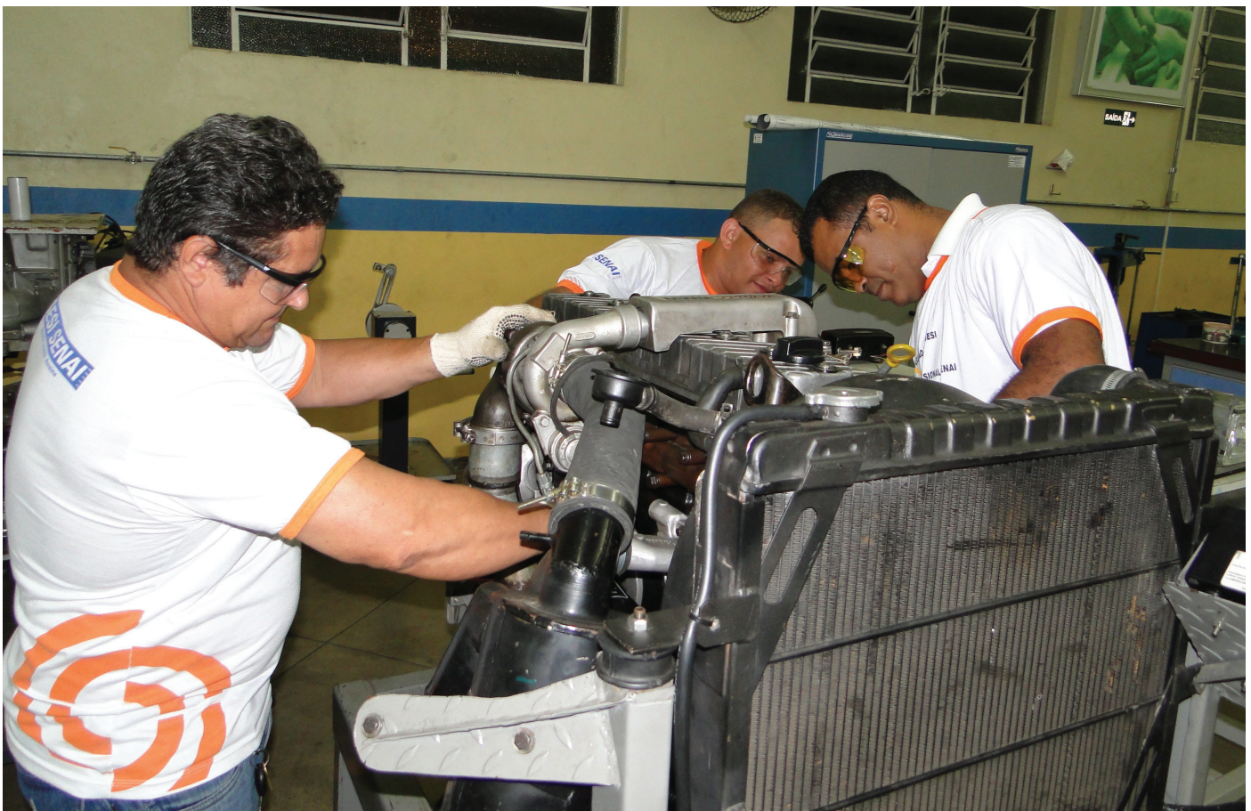
Sesi e Senai são parceiros na articulação do Programa de Educação Básica e Profissionalizante - EBEP

O SENAI e o SESI oferecem aos trabalhadores da indústria a oportunidade de cursarem o ensino fundamental e médio simultaneamente com o profissionalizante. Esta ação refere-se ao projeto EBEP – Educação Básica do SESI articulada com a Educação Profissional do SENAI.