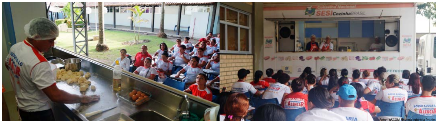
120 colaboradores aprendem dicas de alimentação saudável e como preparar refeições aproveitando 100% dos alimentos

No período de 16 a 18 de outubro, o Programa de Educação Alimentar do SESI, Cozinha Brasil em parceria com o Supermercado Alencar realizou um ciclo de palestras e cursos de culinária para 120 colaboradores da empresa.