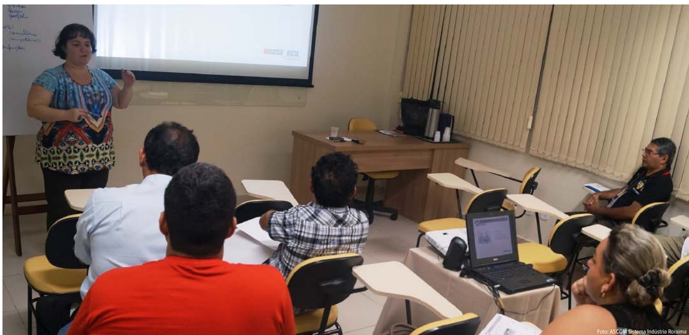
Empresários recebem dicas de como melhorar a comunicação e o relacionamento em suas empresas