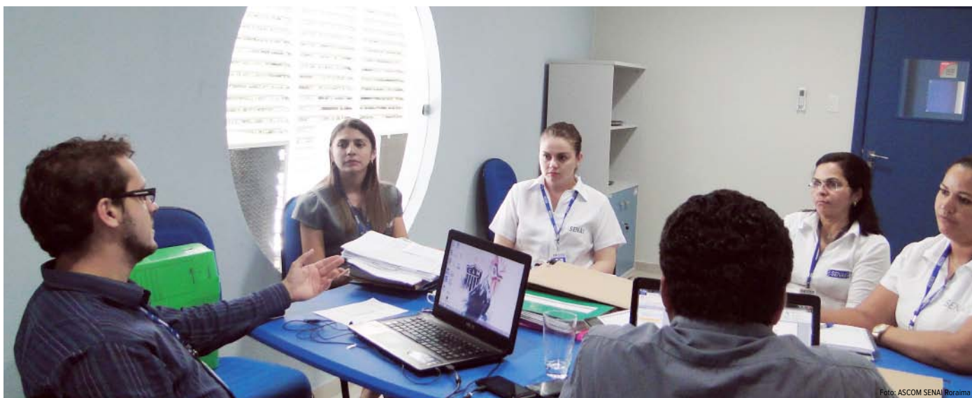
Avaliadores visitam SENAI Roraima para monitoramento do Pronatec

O Centro de Formação Profissional Prof. Alexandre Figueira Rodrigues – CFP recebeu no período de 20 a 23 de outubro a visita de dois integrantes da equipe de monitoramento do Programa Nacional de Acesso ao Ensino Técnico e Emprego – Pronatec. Os técnicos são auditores independentes, contratados pelo Departamento Nacional, e tem como objetivo coletar informações acerca das instalações físicas, recursos didáticos, financeiro e processos pedagógicos.