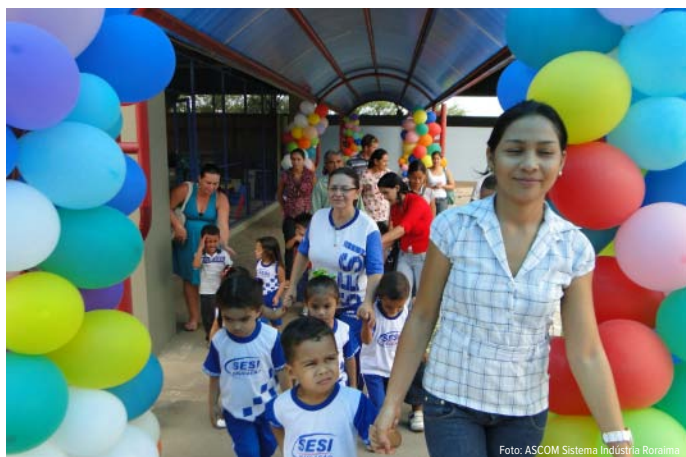
Os trabalhadores interessados podem se dirigir a secretaria da Escola e preencher a ficha de solicitação de vaga para o maternal

Isso ocorre porque o SESI foi criado para atender a indústria e aos seus dependentes com serviços de educação, saúde, lazer e responsabilidade social, priorizando esta clientela.