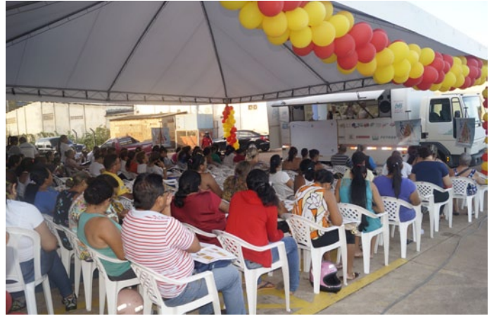
Curso do Cozinha Brasil em parceria com a Clínica Renal em 2016

As capacitações são abertas para a comunidade, mas as vagas são limitadas a 80 inscrições para a primeira turma e 60 para a segunda. Os cursos serão realizados no SESI, localizado na Avenida Bri-