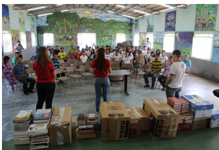
Doação de Livros ao CETRAM

No dia 8 de agosto, os alunos da Modalidade de Aprendizagem Industrial no curso de Auxiliar Administrativo 2014.2 do SENAI Roraima, realizaram uma campanha para arrecadação de livros, com objetivo de doar a biblioteca do Centro de