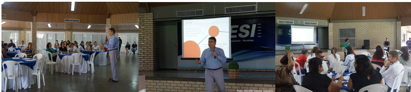
Prêmio Finep é apresentado aos empresários em café da manhã no tapiri do Sesi

No dia 12 de agosto, o Instituto Euvaldo Lodi e a Federação das Indústrias de Roraima – FIER, em parceria com a Finep Inovação e Pesquisa, realizaram um encontro para apresentar o Prêmio aos empresários Roraimenses.