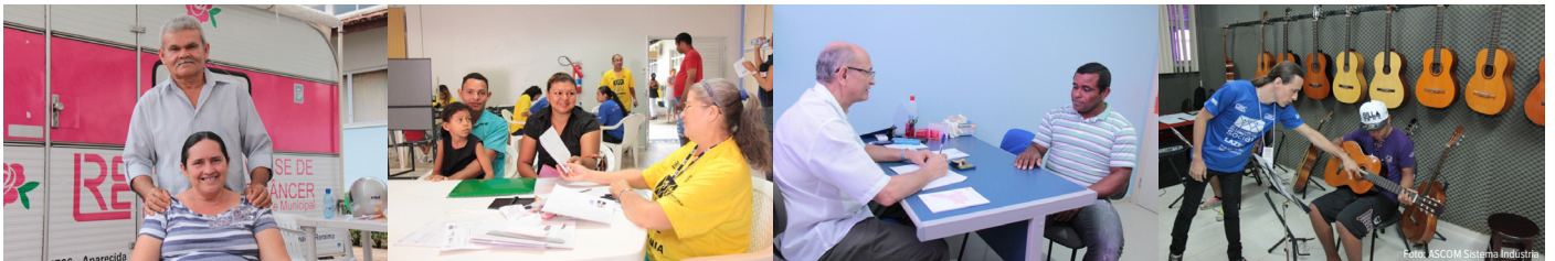
Trabalhadores da construção civil e seus dependentes terão acesso à serviços de saúde, cidadania e lazer

O dia 23 de agosto será dedicado exclusivamente aos trabalhadores da construção civil e seus dependentes, com serviços gratuitos de saúde, lazer e promoção da cidadania. O Dia Nacional da Construção Social acontecerá na sede do SESI, localizado na Av. Brigadeiro Eduardo Gomes, 3710 – Aeroporto, , a partir das 8h.