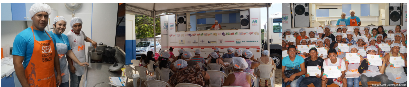
Cozinha Brasil leva aos participantes dicas de educação alimentar e ainda uma forma de melhorar a renda familiar

Nos dias 18, 19 e 20/08, acontecerá o curso de culinária saudável na Associação dos Moradores do bairro Cauamé, das 19h às 22h30, com a previsão de realizar 60 atendimentos.