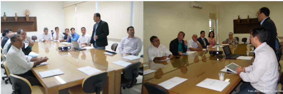
Empresários industriais e dirigentes da FIER conheceram o projeto que trata da implantação do Selo Verde

A Comissão de Direito Ambiental da Ordem dos Advogados do Brasil – OAB, solicitou à Federação das Indústrias de Roraima – FIER, reunião para a apresentação de proposta para a implantação do Selo Verde