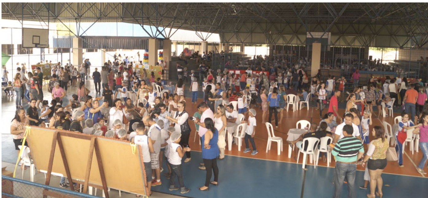
Ao todo foram 25 projetos das turmas do Maternal ao 9º Ano.

Mais de mil pessoas visitaram as "miniempresas". Evento teve recorde de público e de vendas