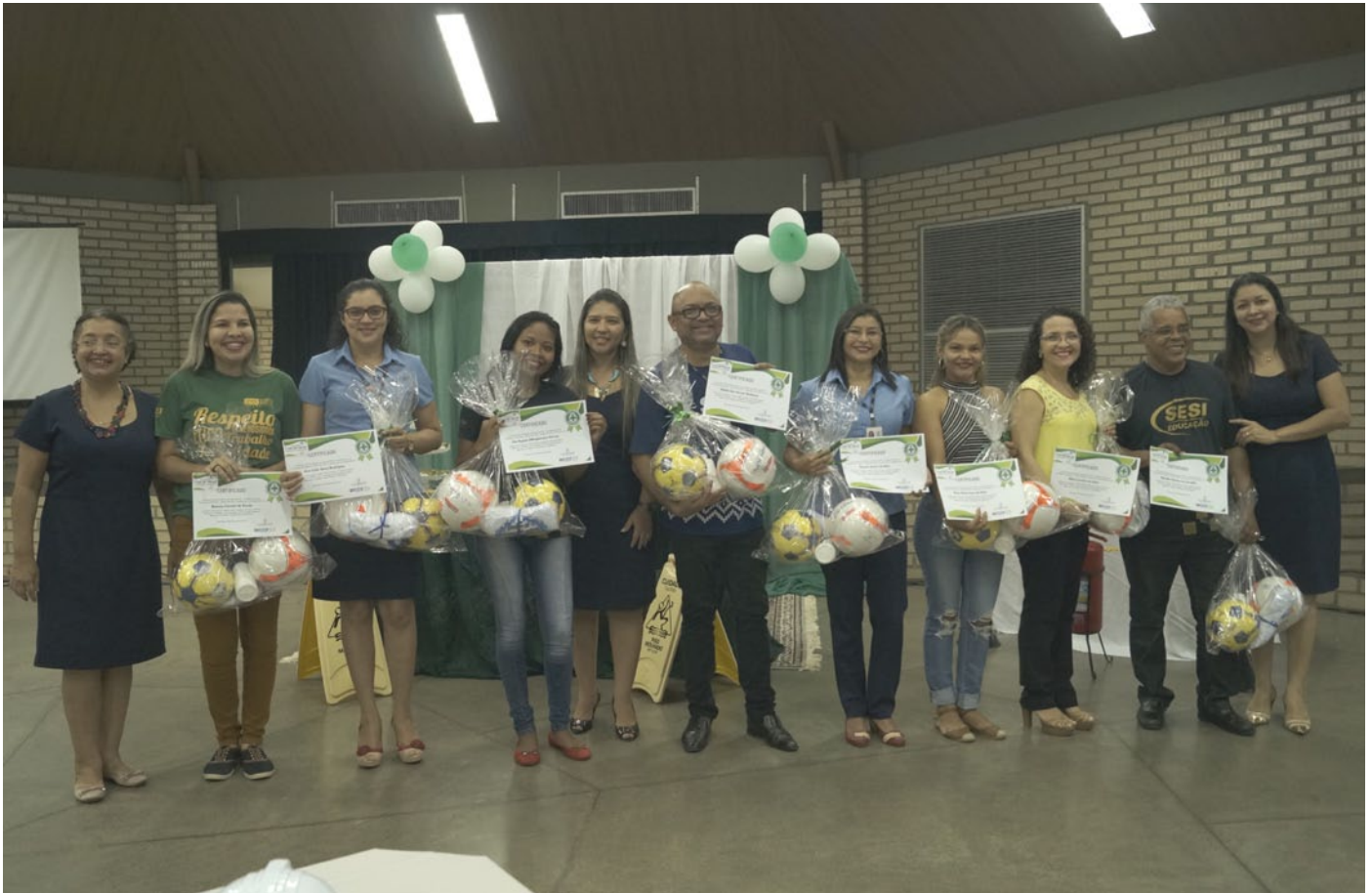
Vencedores durante cerimônia de premiação.

A Comissão Interna de Prevenção de Acidentes do SESI – CIPA, realizou, no mês Abril, o concurso “Ajude o SESI a construir 10 dicas de Saúde e Segurança no Trabalho e criação da marca sobre o mesmo tema”, com o objetivo de fortalecer na instituição a cultura da prevenção de acidentes de modo a assegurar um ambiente saudável e produtivo a partir da elaboração de um trabalho com identidade própria, construído com a participação de todos.