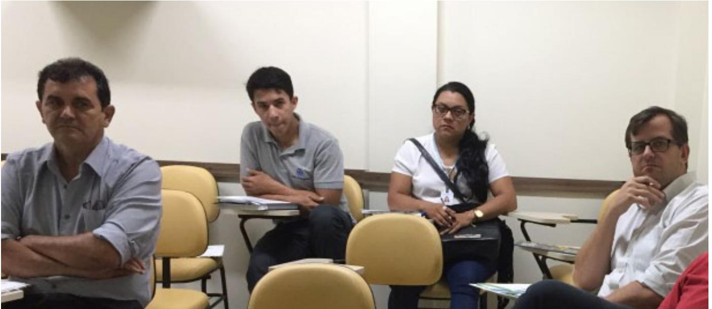
Participantes durante a Capacitação.

A Federação das Indústrias do Estado de Roraima - FIER, por meio do Centro Internacional de Negócios - CIN e, em parceria com Sebrae Nacional, proporcionou aos empresários e trabalhadores de diversos segmentos da indústria roraimense, a capacitação "Formação do Preço de Exportação e Análise da Competitividade em Mercados Externos", na última segunda-feira, dia 5 de junho, em sua sede.