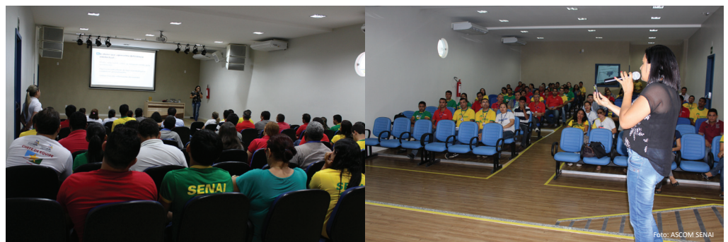
Mais de 60 colaboradores participaram de palestra sobre inclusão social

Nesse sentido, o SENAI já possui um trabalho consolidado, trata-se do Programa de ações Inclusivas – PSAI que é coordenado pelo Departamento Nacional e objetiva incluir, nos cursos do SENAI, pessoas com deficiência - PCD, além de expandir o atendimento a negros/índios, bem como requalificar na educação profissional pessoas acima de 45 anos, ampliando assim as suas possibilidades de inserção e permanência no mercado de trabalho.