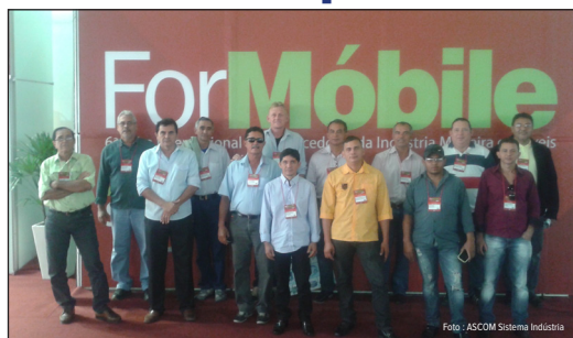
Empresários estreitam laços com novos fornecedores

O industrial e Presidente do Sindicato das Indústrias de Marcenaria