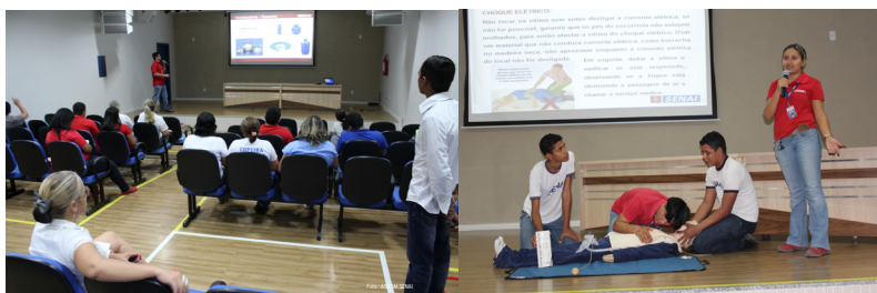
Palestras do PPRa

Por meio do PPRa (Programa de Prevenção de Ruídos Ambientais) pode-se conseguir a diminuição de afastamento por