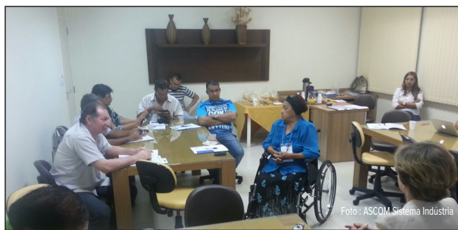
O Associativismo foi o foco principal para debate da gestão de projetos

“O PDA foca fortemente no associativismo e eles entenderam que esse trabalho em conjunto se multiplica com a boa gestão estratégi-