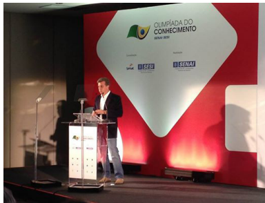
Luciano Huck Fala sobre a alegria de ser o Embaixador da Olimpíada do Conhecimento