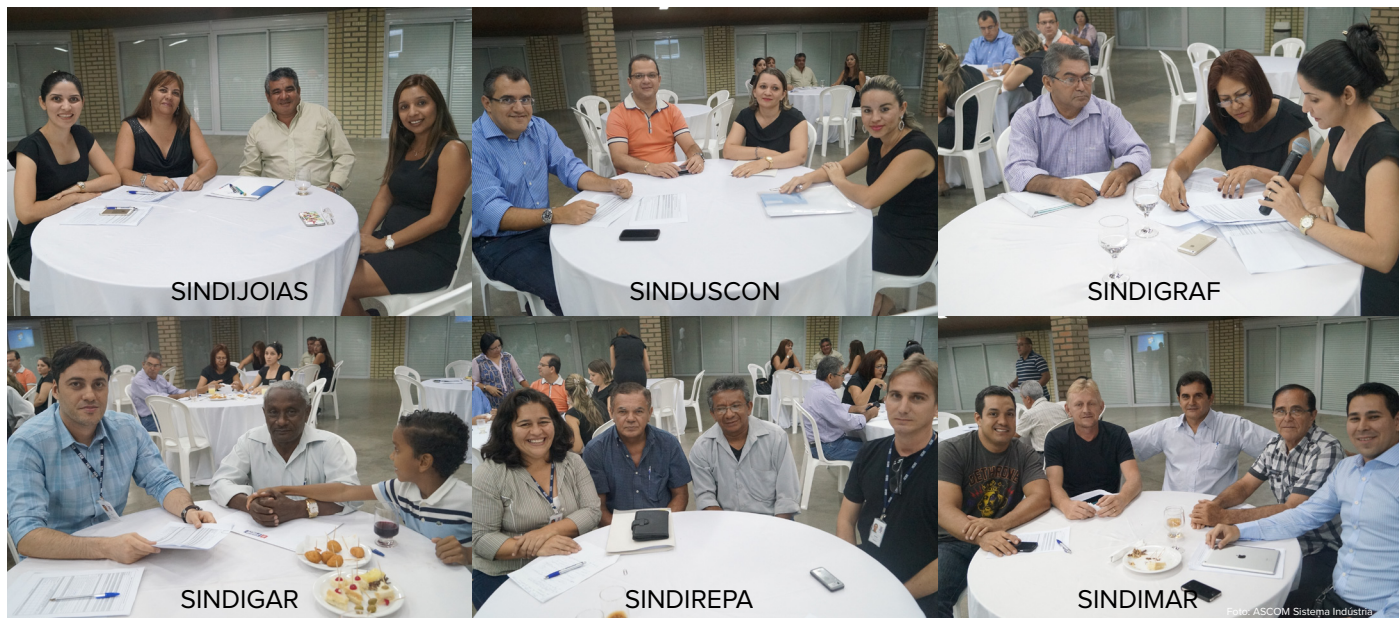
As propostas escolhidas pelas lideranças sindicais em Roraima serão encaminhadas para a CNI

Na noite do dia sete de agosto, no Tapiri do Sesi, como parte das ações do projeto Eleições 2014 - Mobilização Sindical, promovido pela Confederação Nacional da Indústria, a Federação das Indústrias de Roraima – FIER, realizou um workshop direcionado para lideranças sindicais patronais, com o objetivo de coletar informações que serão consolidadas em um documento que será encaminhado pela CNI a quem for eleito para a presidência da república.