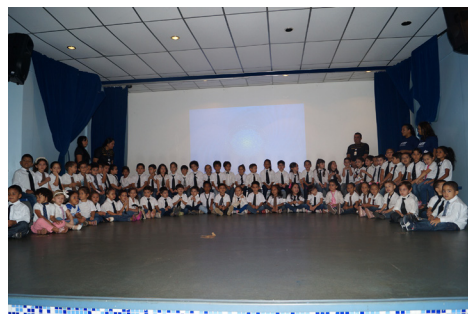
Alunos emocionaram os pais com diversas apresentações