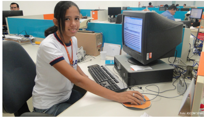
Aprendizes na prática

A Aprendizagem está nas raízes do SENAI, faz parte, inclusive, de seu nome – Serviço Nacional de Aprendizagem Industrial, por isso há uma preocupação maior com esses jovens aprendizizes. Para a pedagoga do SENAI, Dio-