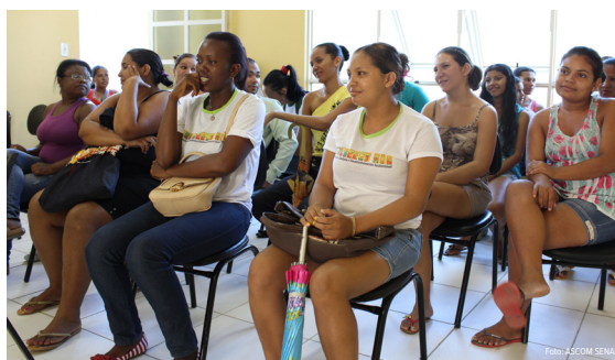
Entrega de Certificados 2.JPG

Os cursos de Agente Sócio Ambiental e Auxiliar de Secretaria de Escola aconteceram no prédio da UNIVIR, no período de 3 meses, com carga horária de