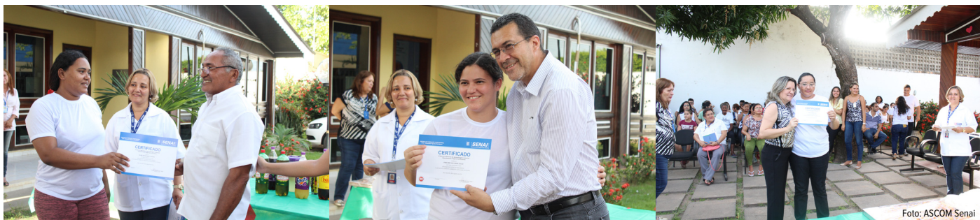
Certificação no CAPs