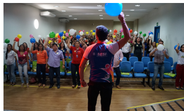
Ginástica laboral - os participantes do Encontro fizeram alongamentos com o profissional do Sesi Roraima

Estudantes, empresários e representantes de instituições de ensino cadastradas no Programa de Estágio do Instituto Euvaldo Lodi - IEL participam na sexta-feira (5), no auditório do SENAI, localizado na Avenida dos Imigrantes, no bairro Asa Branca, da Edição 2014 do Encontro IEL de Estágio.