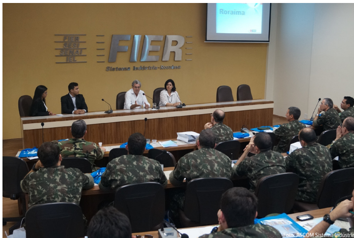
Militares da ECEME visitam Roraima para estudos estratégicos sobre a Amazônia Ocidental.