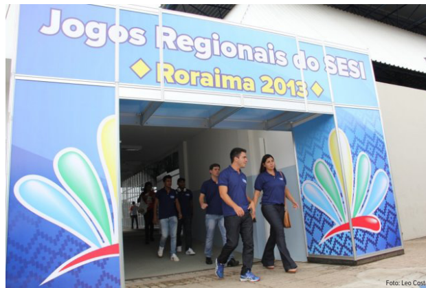
JOGOS REGIONAIS 2013

Os Jogos do Sesi são realizados como forma de oferecer melhor qualidade de vida ao trabalhador. A competição tem início com torneios internos nas empresas para, em seguida,