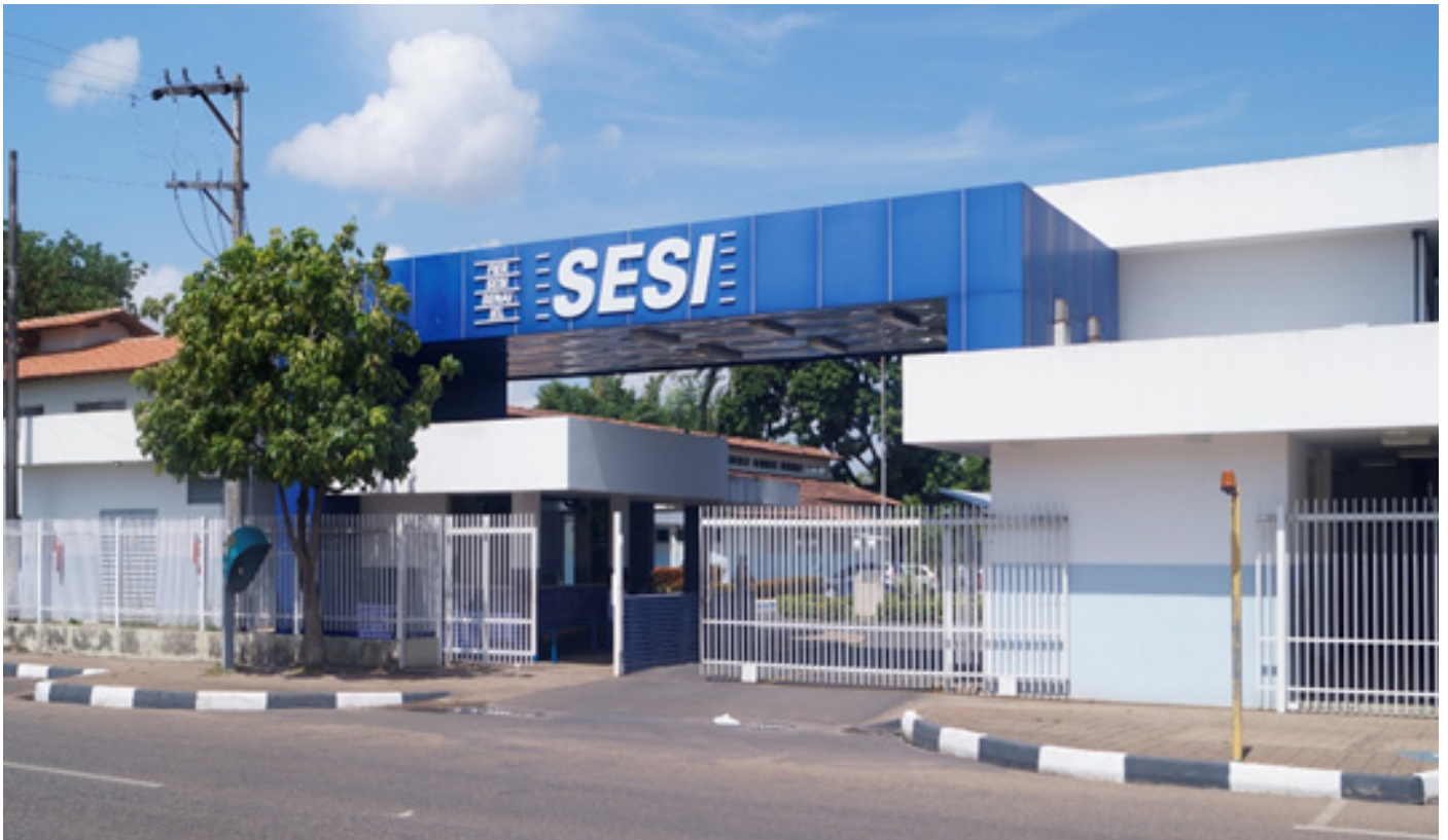
SESI-RR presta serviços para indústria, trabalhadores, dependentes e à comunidade roraimense

Neste mês de agosto, o Serviço Social da Indústria – Sesi/RR completa 34 anos de serviços prestados, dedicação e forte atuação no estado de Roraima. São três décadas com uma visão de futuro em que busca ser conhecido como o braço social da indústria trazendo soluções em Educação, Segurança no Trabalho e Promoção da Saúde.