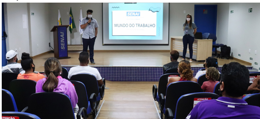
Abertura e Integração pela equipe pedagógica SENAI