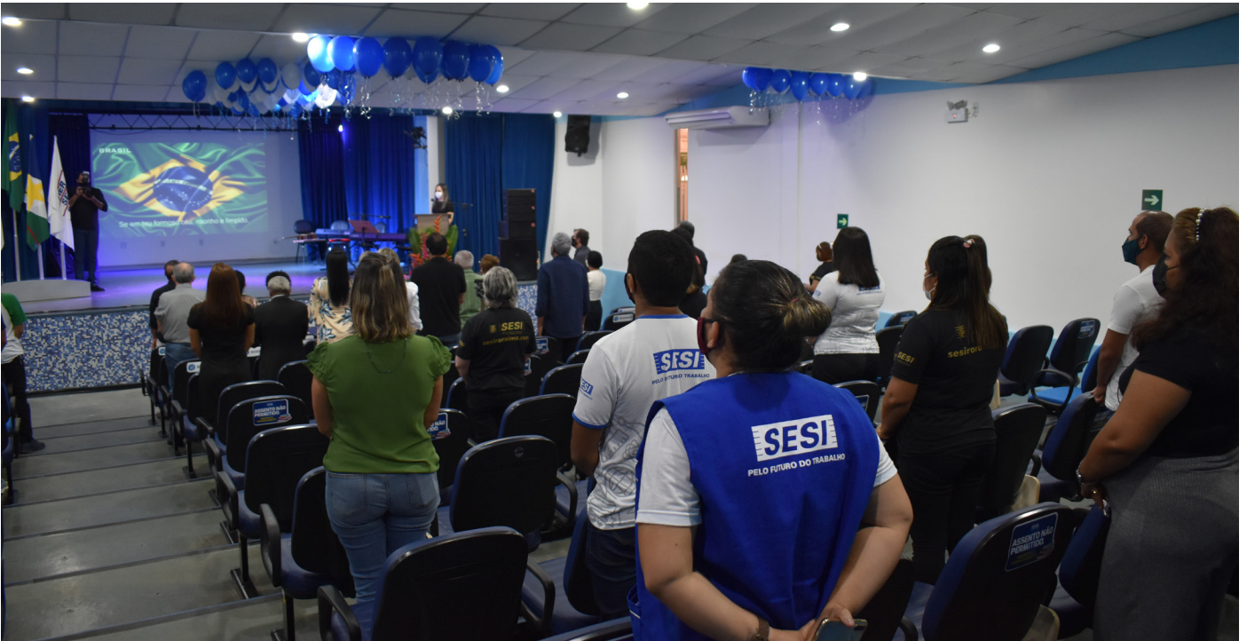
Convidados cantando o Hino Nacional, na cerimônia de 34 anos do SESI-RR

Em comemoração aos 34 anos de trabalho e conquistas nos campos da Educação, Segurança e Saúde do Trabalho e Promoção da Saúde, o Serviço Social da Indústria – SESI/RR realizou uma solenidade na tarde desta sexta-feira (13) no auditório da Escola do SESI, localizado no bairro aeroporto, zona norte de Boa Vista.