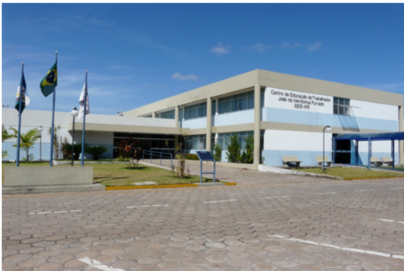
Escola do SESI que possui um espaço físico moderno para atender a demanda de uma educação cada vez mais inclusiva

Assim valorizando essa gestão de excelência, o SESI-RR segue ano após ano buscando melhorar institucionalmente para seguir sendo o parceiro das empresas e trabalhadores industriais, contribuindo com o fortalecimento do estado de Roraima.