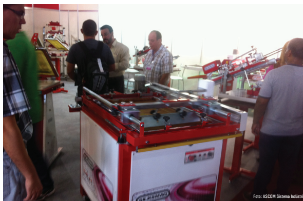
Empresários Roraimenses durante a Feira Serigrafia SIGN Future TEXTIL, realizada em São Paulo

A missão faz parte das ações do Programa de Apoio à Competitividade dos