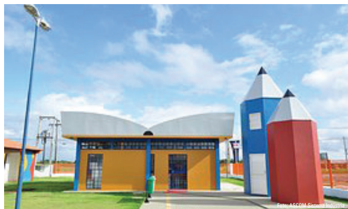
SESI dispõe de duas unidades da Indústria do Conhecimento

A visita à biblioteca já faz parte da programação dos alunos do Programa Atleta do Futuro, desenvolvido pelo SESI, nas depen-