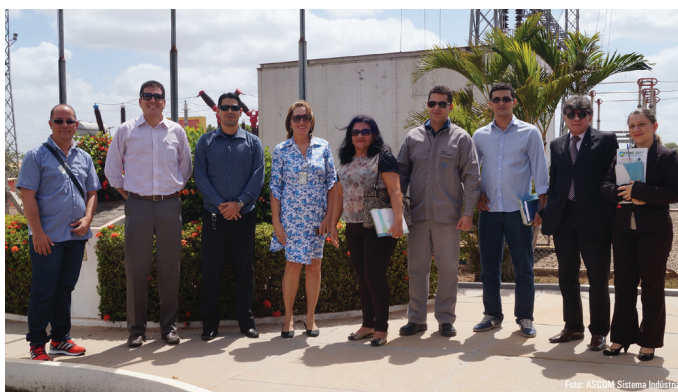
Membros e convidados do CTR-SRT durante visita a subestação da Eletrobrás/Eletronorte localizada no Monte Cristo III

Em um primeiro momento, na sede da Eletrobrás/Eletronorte foi realizada a apresentação do Programa de Manutenção Produtiva Total- TPM, que trata-se de um controle da qualidade no trabalho, a partir dos quais foram se desenvolvendo várias práticas inclusive relacionadas à segurança no trabalho. O programa foi vencedor do Prêmio SESI de Qualidade no Trabalho – PSQT.