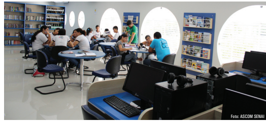
A Biblioteca funciona de Segunda a Sexta das 7h30 às 22h. O acervo conta com mais de 3.000 exemplares

O novo ambiente funciona de segunda a sexta das 7h30 às 22h, disponibiliza 8 computadores com acesso a internet, 1 salão amplo de leitura com capacidade para 24 lugares, 1 sala de estudo com capacidade para 20 pessoas, 1 videoteca com capacidade para 30 telespectadores, ambiente totalmente climatizado, mobiliário e equipamentos eletrônicos renovados.