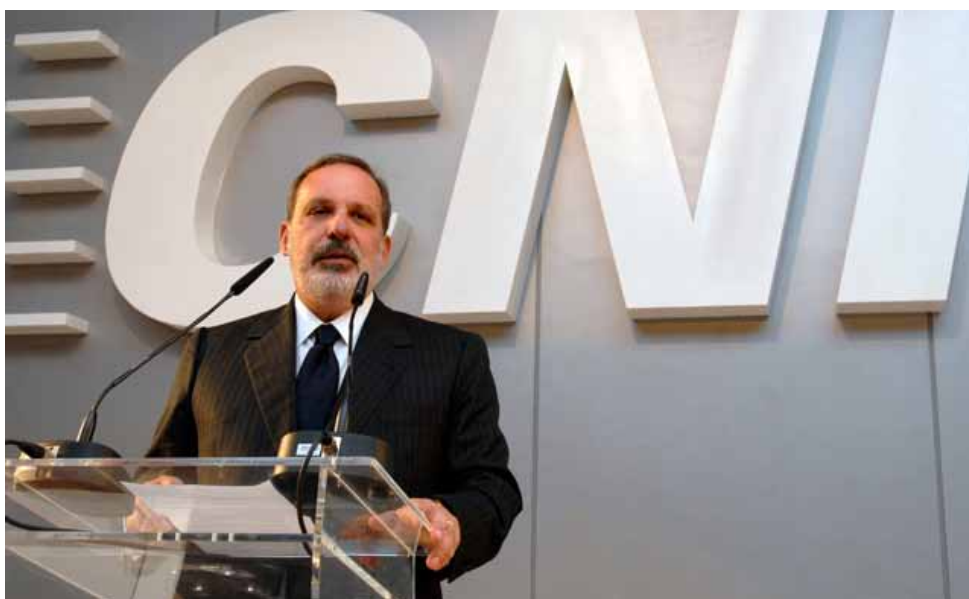
Industriais comemoram a escolha do ex-presidente da CNI e atual senador Armando Monteiro Neto para o Ministério do Desenvolvimento, Indústria e Comércio Exterior

A Confederação Nacional da Indústria (CNI) avalia que a escolha do senador Armando Monteiro Neto (PTB-PE) para ocupar o Ministério do Desenvolvimento, Indústria e Comércio Exterior (MDIC) fortalecerá a relação do setor produtivo com o governo. A CNI acredita que somente com a união de forças o país poderá retomar o crescimento da indústria e de sua economia. “Desejamos que o novo ministro tenha sucesso na implementação de políticas que aumentem a competitividade do país. O Brasil enfrenta hoje os desafios de aumentar a produtividade e de reduzir o custo de produção. Não se faz um país forte sem uma indústria forte”, afirma o presidente da CNI, Robson Braga de Andrade.