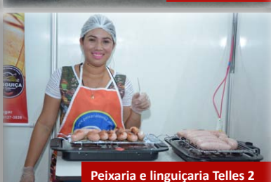
Peixaria e lingüçaria Telles 2