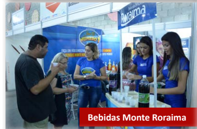
Bebidas Monte Roraima