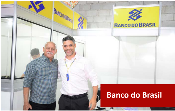
Banco do Brasil