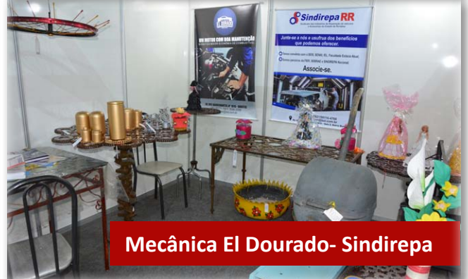
Mecânica El Dourado- Sindirepa