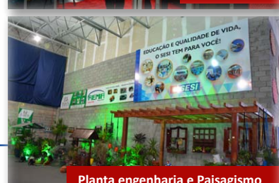
Planta engenharia e Paisagismo