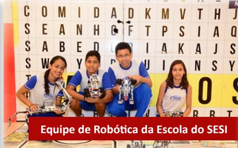
Equipe de Robótica da Escola do SESI