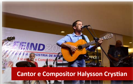
Cantor e Compositor Halysson Crystian