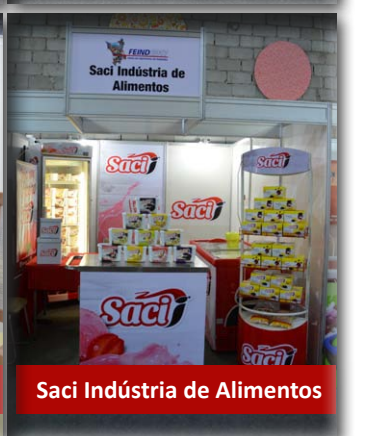
Saci Indústria de Alimentos

Este ano, além dos itens tradicionais da indústria local, novos produtos e tecnologias chamaram a atenção dos visitantes.