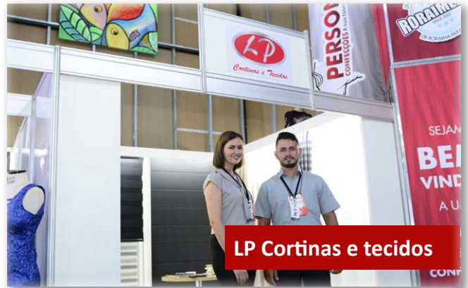
LP Cortinas e tecidos