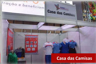
Casa das Camisas