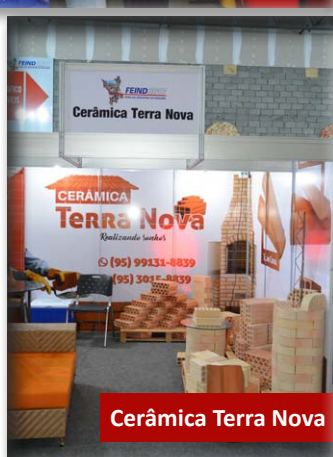
Cerâmica Terra Nova