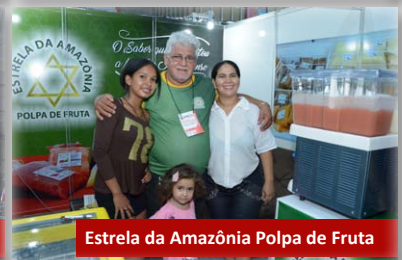
Estrela da Amazônia Polpa de Fruta