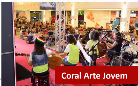
Coral Arte Jovem