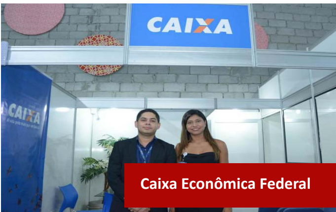
Caixa Econômica Federal