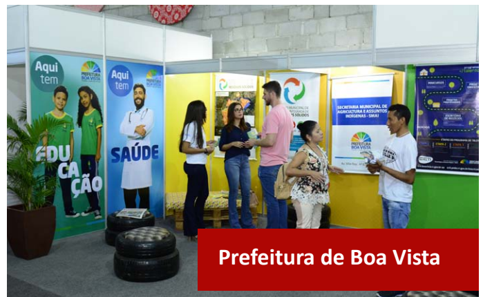
Prefeitura de Boa Vista

A FEIND 2017 contou com o patrocínio do SEBRAE, Caixa Econômica, Prefeitura de Boa Vista e Banco do Brasil que acreditaram na realização da maior feira da indústria local, por entenderem a importância desta iniciativa para impulsionar a economia de Roraima e fortalecer as cadeias produtivas.