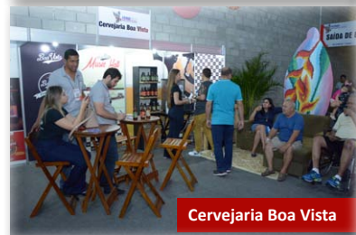
Cervejaria Boa Vista