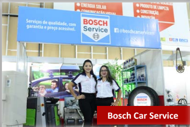
Bosch Car Service