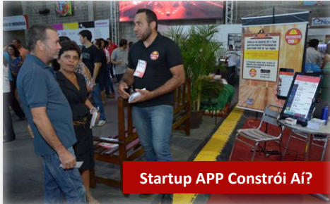
Startup APP Constrói Aí?