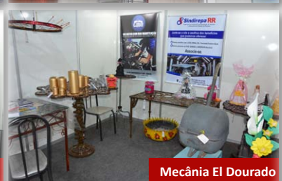
Mecânica El Dourado