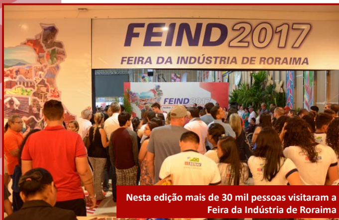
Nesta edição mais de 30 mil pessoas visitaram a Feira da Indústria de Roraima

A Feira da Indústria de Roraima - FEIND 2017 foi realizada pela Federação das Indústrias do Estado de Roraima (FIER), Serviço Social da Indústria (SESI) e Serviço Nacional de Aprendizagem Industrial (SENAI), com o patrocínio do SEBRAE, Caixa Econômica, Prefeitura de Boa Vista e Banco do Brasil, apoio do Instituto Euvaldo Lodi (IEL) e da Confederação Nacional da Indústria (CNI).