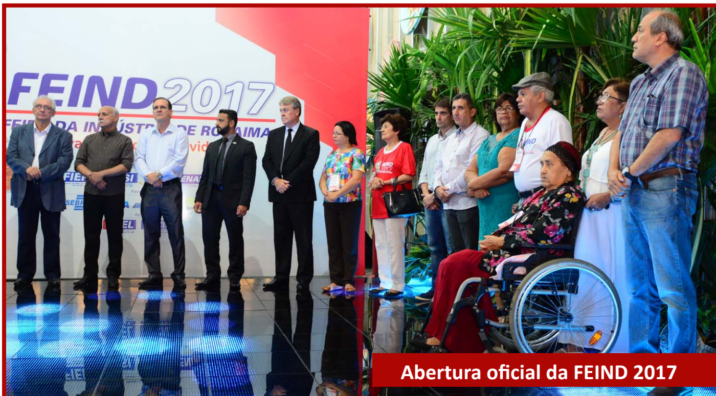
Abertura oficial da FEIND 2017

Em sua 4ª edição a Feira da Indústria de Roraima foi um sucesso. O evento registrou 31.876 visitantes nos três dias