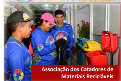
Associação dos Catadores de Materiais Recicláveis