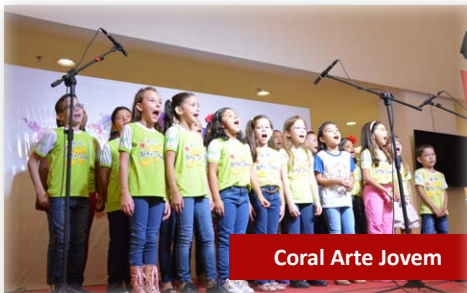
Coral Arte Jovem