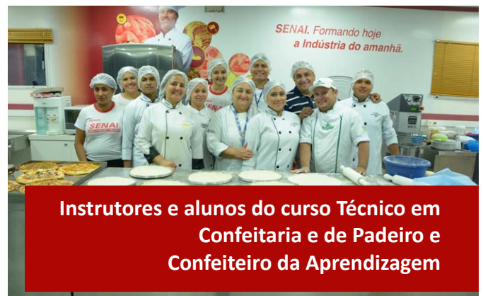
Instrutores e alunos do curso Técnico em Confeitaria e de Padeiro e Confeiteiro da Aprendizagem