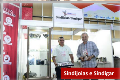
Sindijoias e Sindigar