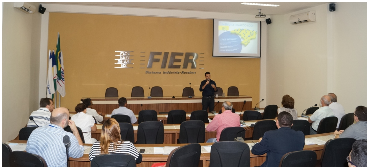
Empresários conheceram o programa e sua forma de adesão.

Na tarde da última quarta-feira (06), empresários, representantes de instituições de ensino privadas, diretores e conselheiros do Sistema Indústria estiveram reunidos na sede da FIER para o lançamento do Inova Talentos, programa que tem o objetivo de ampliar o número de profissionais qualificados em atividades de inovação no setor empresarial brasileiro.