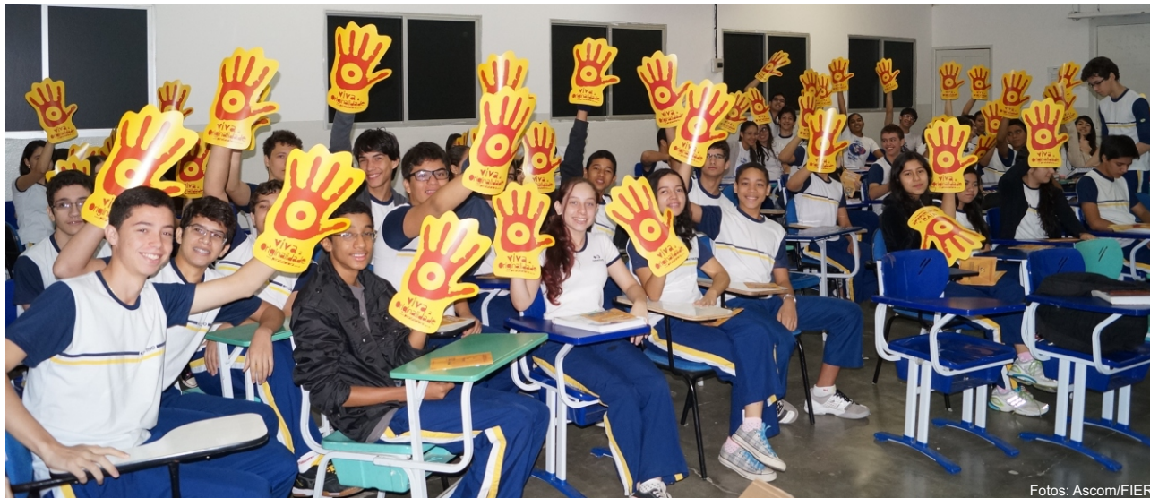
Alunos do Colégio Objetivo dizem não à pirataria.