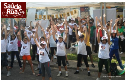
Saúde e qualidade de vida é a proposta da TV Roraima na realização do “Saúde de Rua”

O SESI irá oferecer ao público avaliação física, massagem corporal, atividades esportivas como mini basquete, mini futebol,