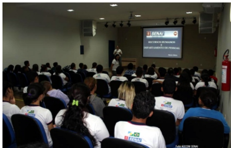
Palestra sobre recrutamento e seleção movimentou o Centro de Formação Profissional do SENAI

A palestra teve o objetivo de esclarecer como ocorrem as etapas de seleção de candidatas e tipos de perfis requeridos pela Instituição.