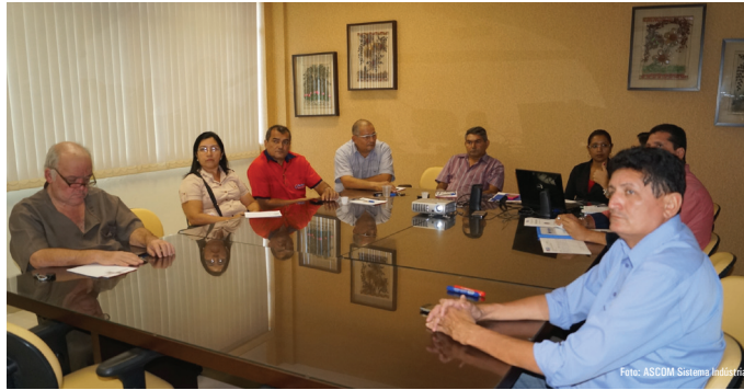
Empresários levantam a questão da baixa qualificação no mercado