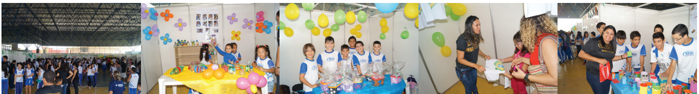
Os alunos começaram a desenvolver os produtos há dois meses, em sala de aula, junto com os professores

Em sua 10ª edição a “Indústria de Talentos”, promovida pelo Centro de Educação do trabalhador João de Mendonça Furtado – CET/SESI foi realizada, o evento aconteceu na quadra da escola, nesta sexta-feira dia 30, nos turnos matutino e vespertino.