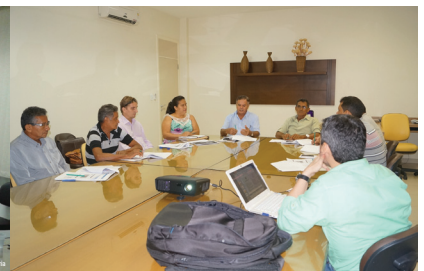
SINDIREPA debatem estratégias para seu desenvolvimento