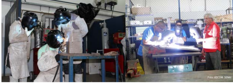
Unidades móveis do SENAI percorrem os municípios do Estado capacitando milhares de pessoas

No Estado de Roraima as empresas informais ainda são maioria, no entanto, são formadas por profissionais que tem buscado qualificação profissional. No SENAI, os cursos disponibilizados possuem carga horária que variam de 40 a 200 horas e podem ser feitos pelo Programa Nacional de Acesso ao Ensino Técnico e Emprego – PRONATEC, pela Gratuidade Regimental ou por meio de cursos pagos.