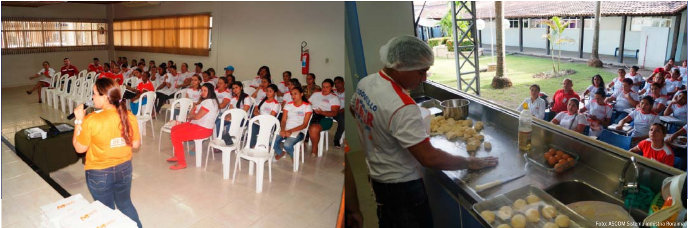
Colaboradores são capacitados em palestra sobre alimentação saudável e aprendem receitas com 100% de aproveitamento dos alimentos

Com o objetivo de evitar o crescente número de alimentos desperdiçados, o Supermercado Alencar firmou uma parceria com o Programa de Educação Alimentar do SESI Roraima, o Cozinha Brasil.