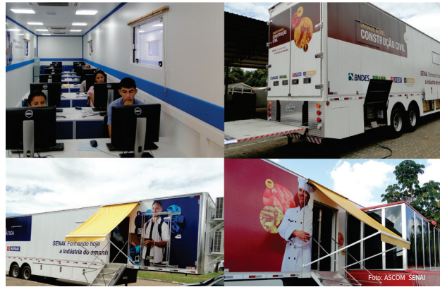
Unidades móveis do SENAI percorrem os municípios do Estado capacitando milhares de pessoas

Outros municípios que estão sendo atendidos são Cantá, Alto Alegre, Rorainópolis, Amajari, São Luiz do Anauá, São