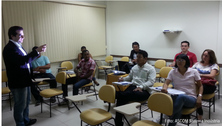
Empresários recebem dicas de como reduzir a tarifa de energia

“A ideia foi expor várias situações e debater com os participan-