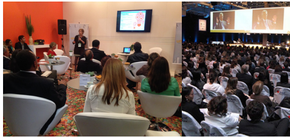
O Congresso de Gestão de Pessoas é considerado o maior evento relacionado à área de Gestão de Pessoas da América Latina

O objetivo é mostrar que, embora a área e o profissional de RH tenham se tornado cada vez mais valorizado nas organizações, a vanguarda do RH constrói pontes, propicia ambientes colaborativos e contribui com efetividade no desenvolvimento de pessoas mais