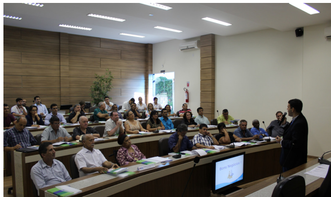
Empresários conhecem condições para obter linhas de crédito junto à CAIXA e ao BNDES

“Pessoa Jurídica Privada, micro, pequenas e médias empre-