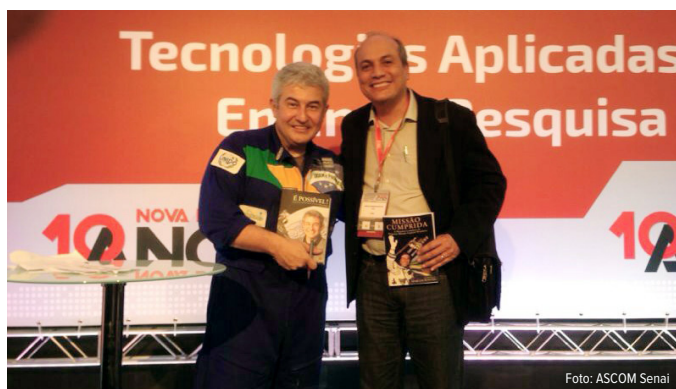
Novas tecnologias aplicadas ao Ensino e Pesquisa é tema de Seminário

O destaque foi para palestra realizada pelo astronauta Marcos Pontes, que é embaixador da ONU para o desenvolvimento industrial- UNIDO, embaixador mundial da WorldSkills International e