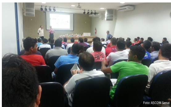
Empresários e alunos conhecem novas tecnologias do ramo automotivo

Além dos sindicalizados, empresários e alunos puderam conhecer novos produtos e quais as tecnologia que estão sendo utilizadas atualmente no setor automotivo, “A palestra a qual levamos são aplicações realizadas dentro das concessionárias, pois nossos produtos são utilizados em todas as montadoras de veículos e a parceria com o SINDIREPA tem nos ajudado a