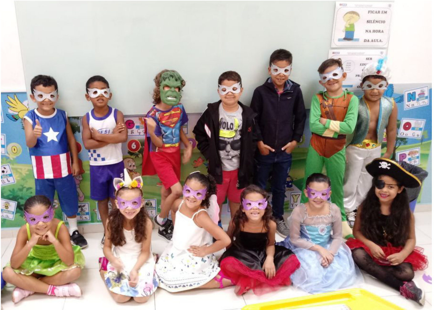
Bailinho do Sesinho de 2018

Bailinho é realizado todos os anos em alusão ao carnaval