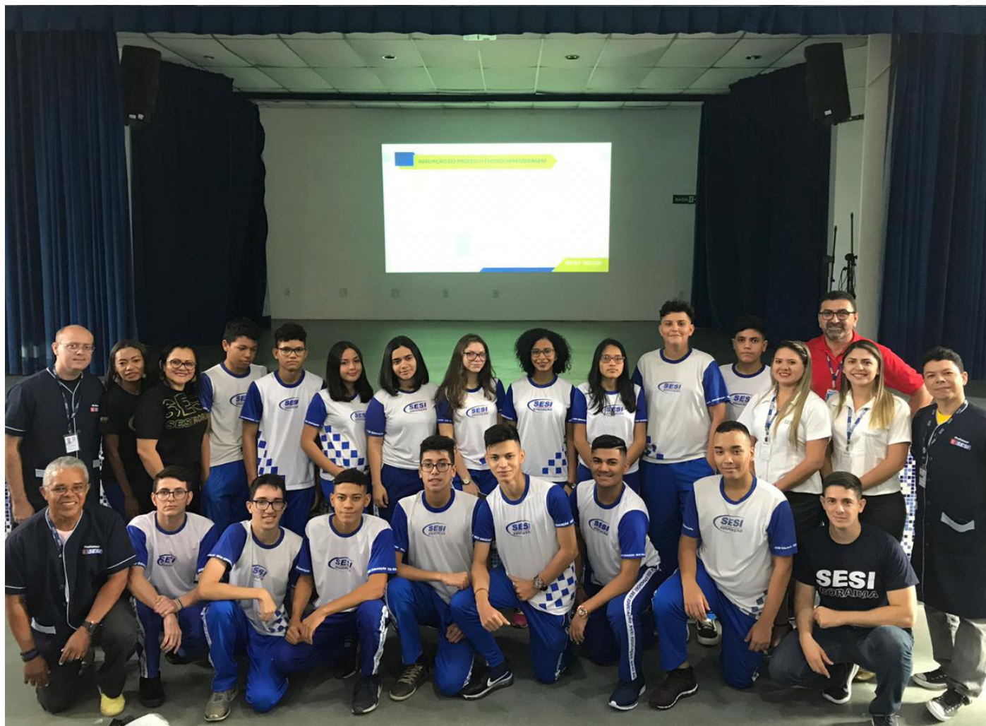
Alunos do Novo Ensino Médio com professores do SESI e SENAI

A instituição é a primeira escola a implantar esse modelo no Estado