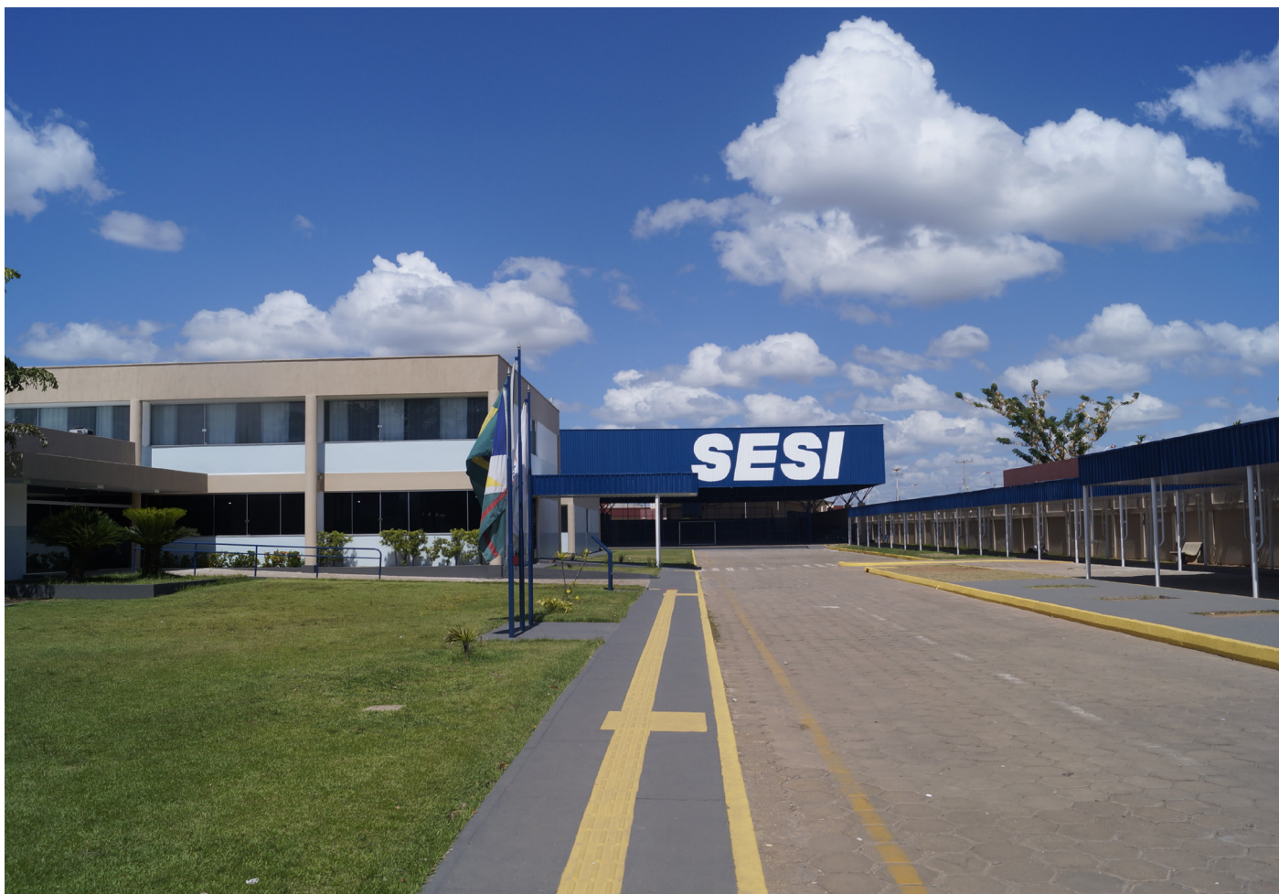
As vagas são para o Ensino Médio

O Serviço Social da Indústria – SESI, por meio do Centro de Educação do Trabalhador João de Mendonça Furtado – CET/SESI, tornou público o edital 002/2019, referente ao Programa de Gratuidade, para os dependentes dos trabalhadores da indústria que recebam até dois salários mínimos e meio.