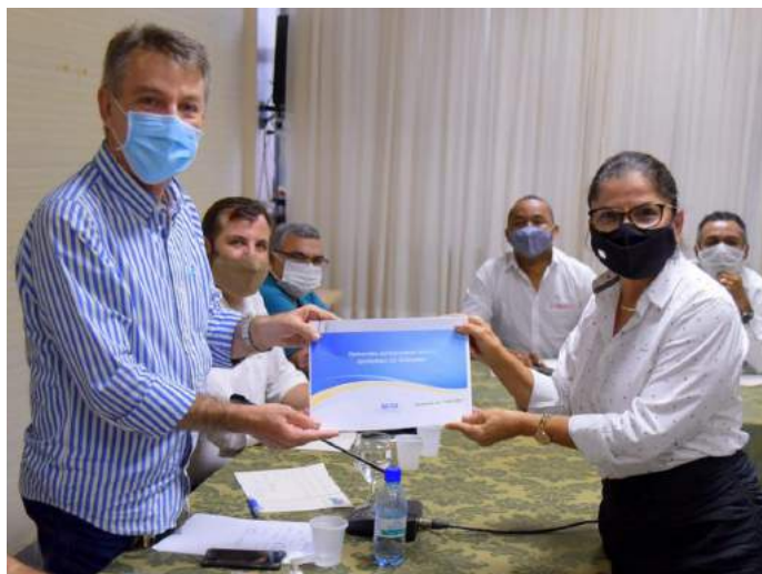
FIER apresentou relatório com o status de todas as demandas que visam a defesa do setor empresarial industrial.

senvolvimento do setor de base florestal e para as empresas geradoras de emprego e renda que estão instaladas no Distrito Industrial.