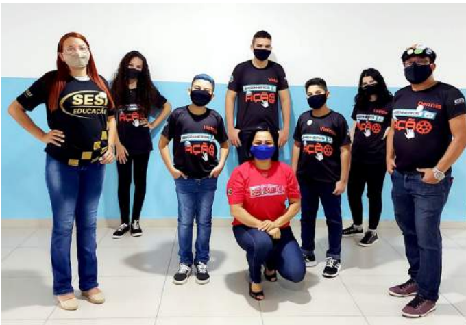
Equipe Engenheiros em Ação.

Na etapa regional do Pará, a equipe Engenheiros em Ação conquistou o primeiro lugar na categoria Core Values e o quarto lugar na classificação geral do torneio que teve com a participação de 23 equipes. Os alunos de Boa Vista apresentaram o projeto games ativos que se propõe a oferecer uma solução para contribuir e estimular a prática de atividades físicas na área infanto-juvenil por meio da realidade virtual.