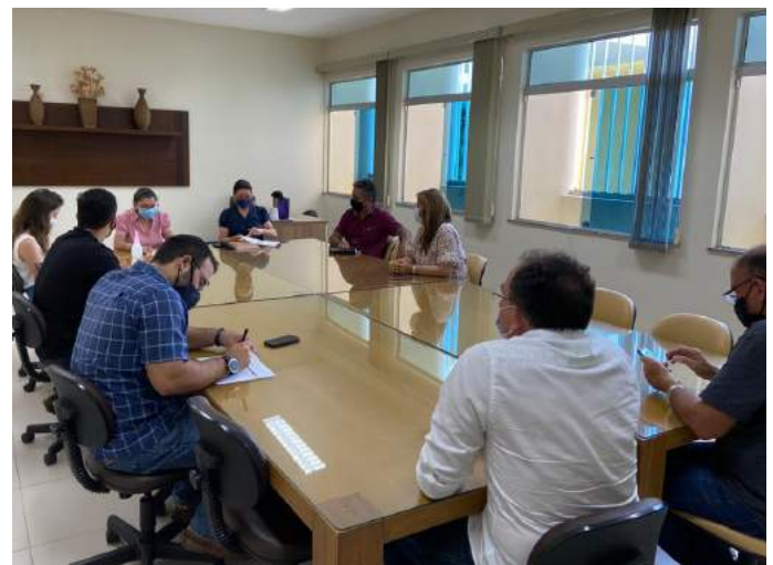
Criação de um IPTU Industrial foi uma das ideias sugeridas para incentivar melhorias no Distrito Industrial.