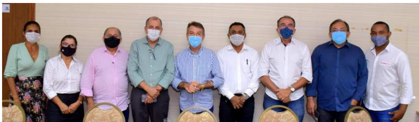
Encontro gerou como resultado a formação de um calendário de encontro de trabalho que será feito em conjunto com o Governo do Estado e todo o setor produtivo roraimense.

Um dos primeiros resultados que ficou acordado entre todas as partes presentes foi a formação de um calendário de encontro de trabalho. Este será estabelecido pelo Governo do Estado e todo o setor produtivo roraimense com intuito de buscar soluções de curto prazo para os problemas enfrentados no dia a dia das empresas.