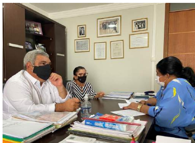
Proposta de criação do Simples Ambiental é levada a comissão de orçamento da ALE-RR.

Durante este momento, a presidente do FIER trouxe sugestões com o intuito de promover amplo