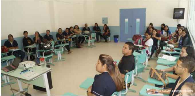
Professores e colaboradores do CET durante capacitação