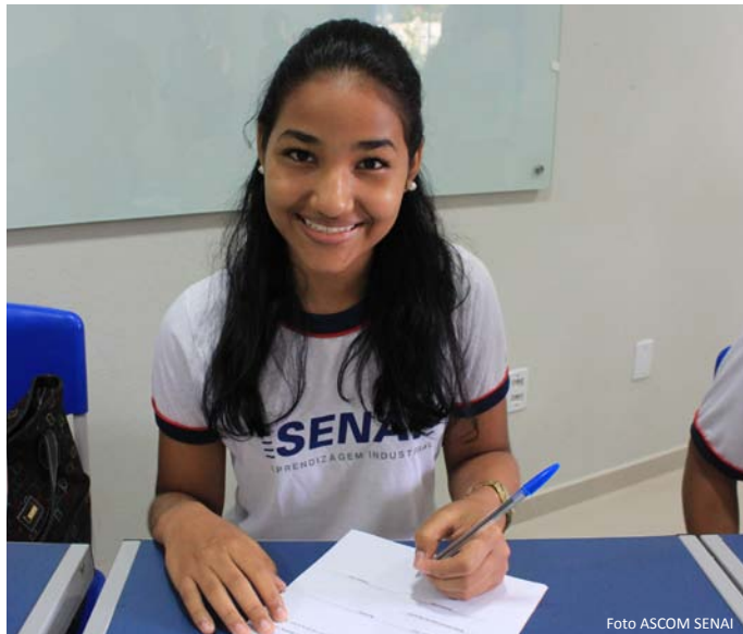
Aprendiz na hora da assinatura do contrato

Esses aprendizes possuem um período para cumprimento de base teórica no ambiente do SENAI, posteriormente trabalha-se com o sistema dual: 2 dias em sala de aula e 3 na empresa e para finalizar ficam exclusivamente cumprindo a prática profissional