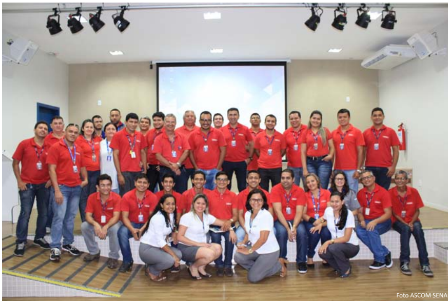
Aprendiz na hora da assinatura do contrato

Os referidos cursos integram a dimensão tecnológica do itinerário nacional de capacitação docente, que assegura um aprimoramento contínuo em suas áreas de atuação e têm como