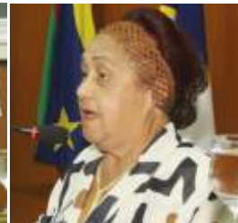
Atuação dos diretores e conselheiros em reuniões e audiências

a Polícia Federal. O Diretor apresentou evidências de que há empresas que não estavam envolvidas na operação e, mesmo assim, ficaram impedidas de