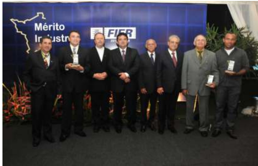
Agraciados com o Mérito Industrial 2012

Categoria instituições, para a Fazenda Esperança, por indicação do Sindicato da Indústria da Construção Civil do Estado de Roraima – SINDUSCON. A segunda instituição homenageada foi o Serviço de Atendimento Móvel de Urgência – SAMU, indicado pelo Sindicato da Indústria de Reparação de Veículos e Acessórios do Estado de Roraima – SINDIREPA.