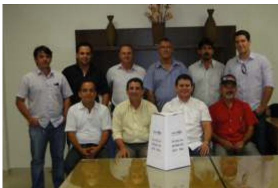
Diretoria eleita do SINDICON ao final da apuração de votos

O Sindicato da Indústria de Construção de Estradas Terraplanagem e Obras do Estado de Roraima – SINDICON realizou no dia 30 de março, na sede da FIER, a eleição para a nova diretoria do sindicato. A chapa única denominada “Excelência” ficou com a seguinte composição: