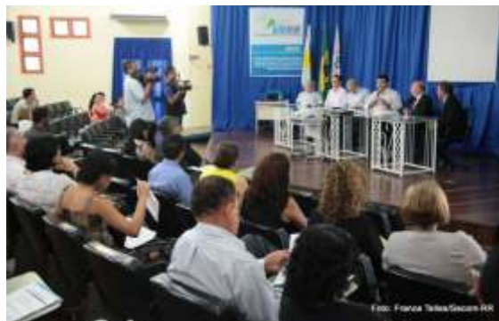
FIER teve representação no I Workshop Brasil e Venezuela