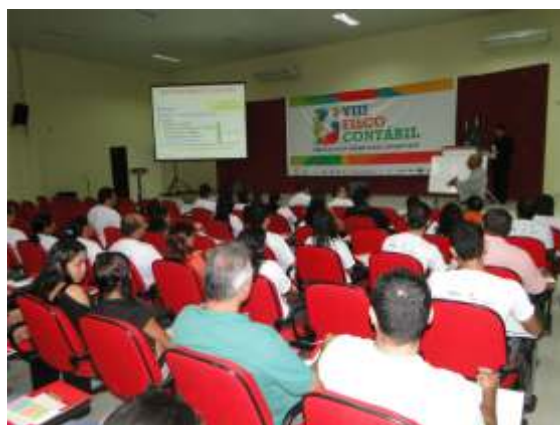
VIII Fisco Contábil teve apoio da FIER

Nos dias 12, 13, 14 e 15 de setembro, o Sindicato das Empresas de Contabilidade e das Empresas de Assessoramento, Perícias, Informações e Pesquisas do Estado de Roraima (Sescon-RR) realizou a oitava edição do Fisco Contábil. Realizado no auditório do Batalhão do Corpo de Bombeiros de Roraima, o Fisco contou com o apoio de diversas instituições, entre elas, a FIER, o SESI e o SENAI. O objetivo do encontro foi de incentivar a qualificação do contabilista frente às necessidades do mercado: no setor público, privado e social.