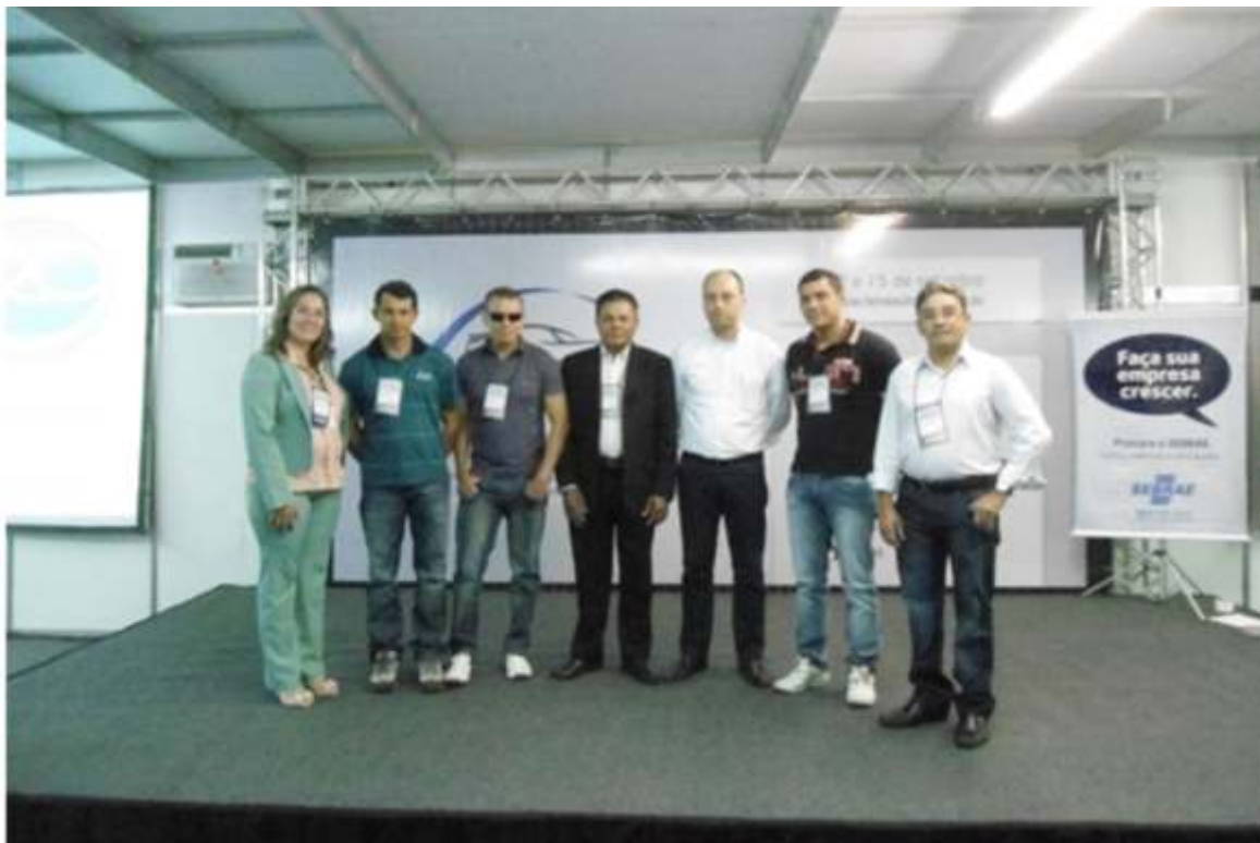
Empresários do setor automotivo durante Feira Autotec2012

Seis empresários do setor automotivo participaram da Missão Empresarial realizada na Feira Auto Tech 2012, no período de 12 a 16 de setembro, em Vitória - ES. O objetivo da missão foi integrar os empresários e facilitar o acesso ao conhecimento de práticas adotadas