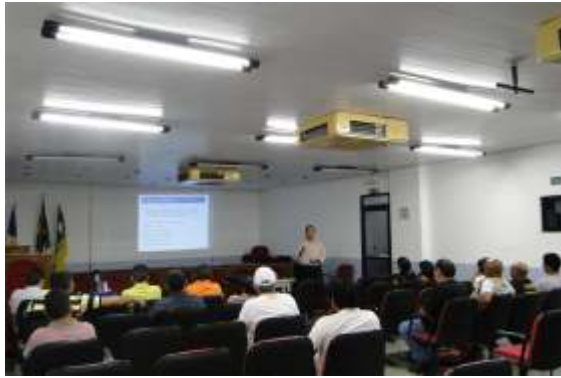
Palestra Procompí Gerenciamento de vendas foi realizada no auditório do IEL

fevereiro e março deste ano com 38 empresas e apontou dados do perfil do segmento da reparação de veículos e acessórios, entre eles o grau de escolaridade, faixa etária do profissional e principal atividade de renda.