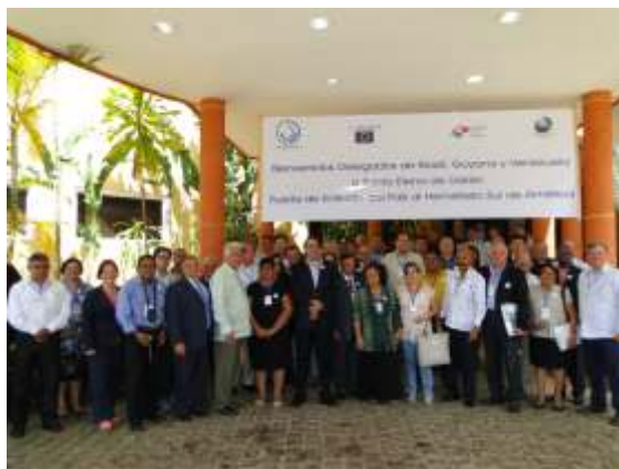
Representantes do Brasil, Guiana e Venezuela durante o Encontro trinacional em Santa Elena – Venezuela

A Federação das Indústrias do Estado de Roraima participou em setembro, do encontro “Fronteira Trinacional: Oportunidade para o progresso e bem-estar”, realizado em Santa Elena de Uairén, na Venezuela.