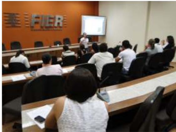
Palestra realizada para os colaboradores

Outra ação do PPRA da FIER foi o curso de “Primeiros Socorros”, ministrado no dia 30 de