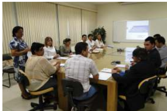
Reunião do CTRSRT