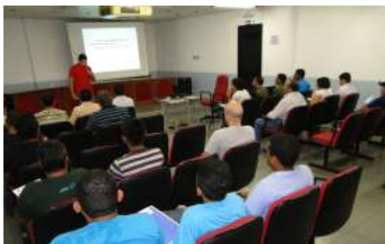
Palestra Eliminação de desperdícios fez parte do PROCOMP Auto-motivo em 2012

contribuir para o melhor uso dos materiais de uso comum nas oficinas, como produtos de limpeza e matéria prima, consumo de energia e de água. Outro tópico abordado foi o desperdício de tempo. Todos esses fatores incidem diretamente nas receitas e despesas da empresa. Participaram da palestra, 30 empresários e colaboradores do setor automotivo.