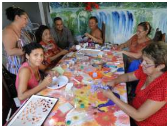
Curso com garrafas PET foi voltado para filiados ao SINDEARTER

SINDUSCON realiza Seminário da Construção Civil