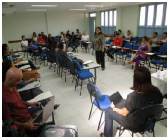
Curso de Comércio Exterior foi realizado em uma parceria entre FIER e SEPLAN

O curso foi uma das ações do Plano Nacional da Cultura Exportadora, por meio do