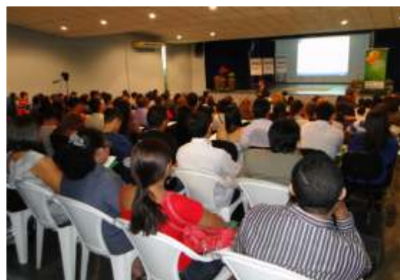
FIER esteve presente no I Seminário de Arrecadação do Sistema Indústria Roraima

Com o tema Os impactos da legislação na contribuição compulsória devida a terceiros , a programação teve como objetivo mostrar as vantagens do correto enquadramento no CNAE e FPAS, bem como as orientações necessárias para o lançamento das informações de acordo