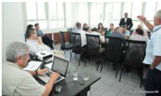
FIER faz parte do grupo de discussão Assessoramento, no projeto Ecoestado