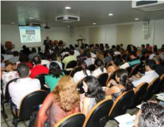
Palestra Lucrando com a Inovação - O evento deu início às atividades do Núcleo de Inovação de Roraima (NIRR)