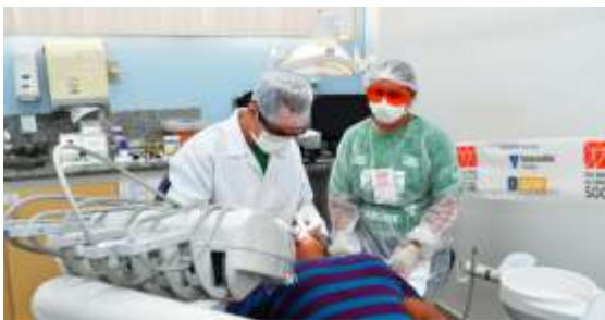
Odontologia foi o serviço mais procurado durante o DNCS

O evento é promovido anualmente pela Câmara Brasileira da Indústria da Construção – CBIC e realizado em parceria com a FIER, SESI e o Sindicato das Indústrias da Construção Civil do Estado de Roraima – SINDUSCON e Sindicato da Indústria e Construção de Estradas, Pavimentação, Terraplanagem e Obras Geral do Estado de Roraima – SINDICON/RR.