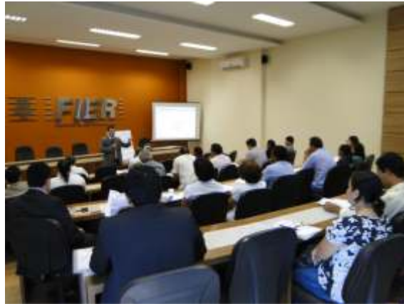
Curso PDA Como evitar problemas trabalhistas foi voltado para empresários

Curso Como Evitar Problemas Trabalhistas