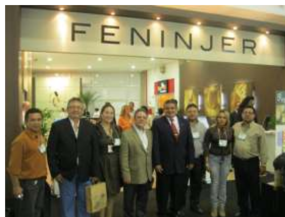
Empresários do setor mineral do Estado, participaram da maior feira do segmento no Brasil

Seis empresários do setor mineral e de jóias participaram da Missão Empresarial realizada no período de 1º a 04 de agosto, em São Paulo – SP. O objetivo da missão foi integrar os empresários do segmento de joalheria, para o conhecimento de práticas adotadas por outras empresas do setor, bem como capacitação e alinhamento com demais sindicatos.