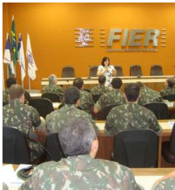
Oficiais do Exército participam de palestra sobre os principais aspectos econômicos de Roraima