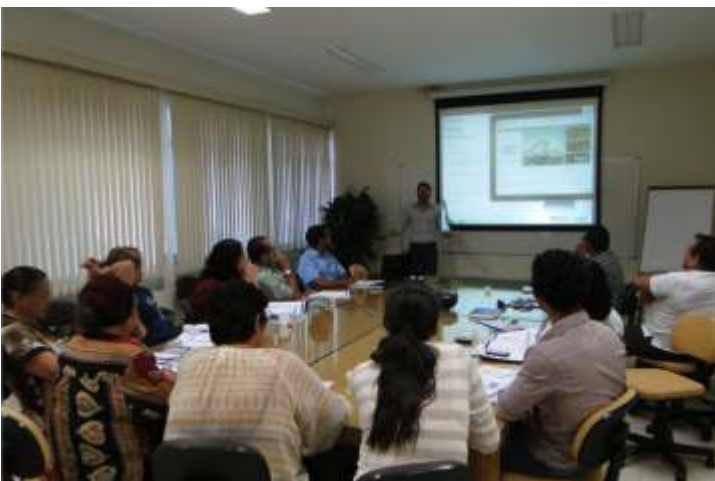
PDA promoveu Palestra Comunicação Digital

A ação contou com a participação dos nove sindicatos filiados à Federação (SINDUSCON, SINDICON, SINDEARTER, SINDIMADEIRAS, SINDIGAR, SINDICONF, SINDIGRAF, SINDIREPA e SINDIPAN) e colaboradores do Sistema Indústria Roraima (FIER, SESI, SENAI e IEL).