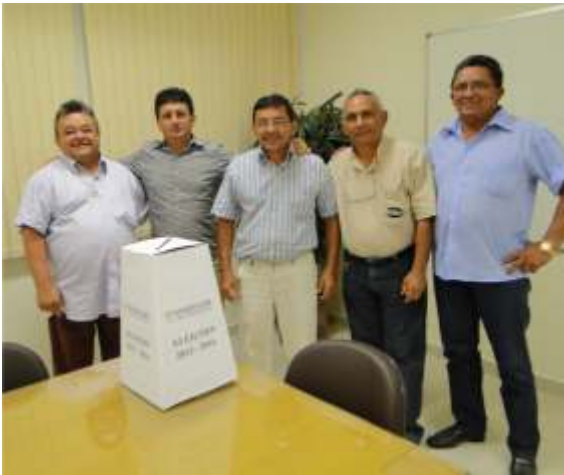
Membros da diretoria do SINDIPAN

O Sindicato das Indústrias de Panificação, Confeitaria e Alimentos do Estado de Roraima – SINDIPAN realizou eleição no dia 4 de junho. A chapa de consenso denominada “Inovação” ficou assim composta: