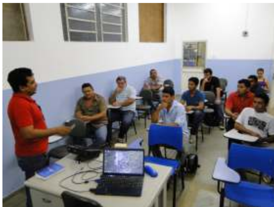
Filiados ao SINDIREPA participam de Curso de Injeção Eletrônica

Realizado no mês de julho, agosto e setembro de 2012. Contou com a participação de 30 colaboradores das empresas industriais da reparação de veículos. O objetivo foi proporcionar conhecimentos e habilidades em injeção eletrônica básica, eletricidade para injeção eletrônica, instrumentos de medição elétrica e outros