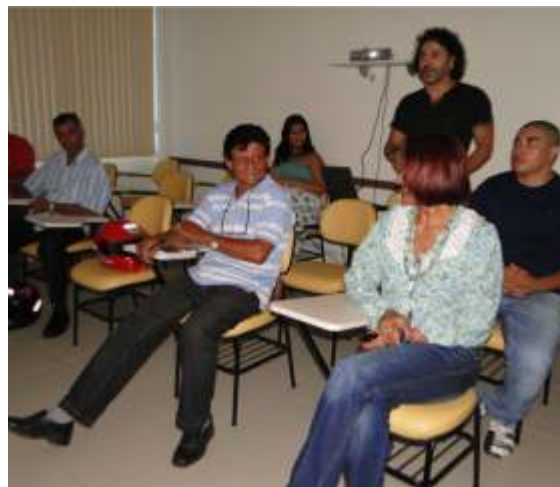
Capacitação AI Invest para o setor moveleiro

Empresários e trabalhadores do setor moveleiro participaram no dia 13 de setembro, na sala de treinamento da FIER, da capacitação Gestão da Qualidade do Projeto AI-Invest.