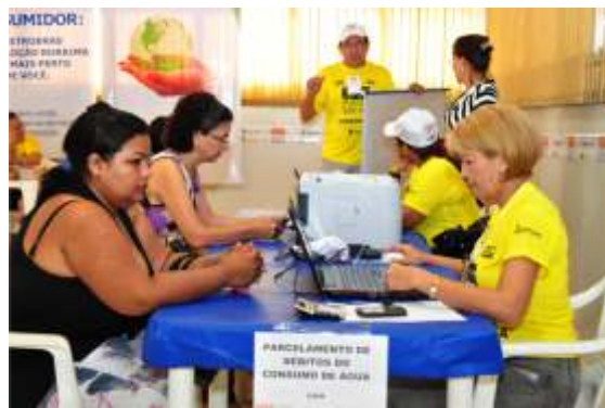
Serviços de cidadania foram oferecidos durante o DNCS

Foram realizados 6.725 atendimentos para 2.242 trabalhadores e seus familiares. Os serviços mais procurados foram os de Lazer, com 2.232 atendimentos, seguidos dos serviços de saúde 2.022, cidadania com 367 e educação 177 atendimentos. Os serviços de odontologia totalizaram 457 atendimentos.