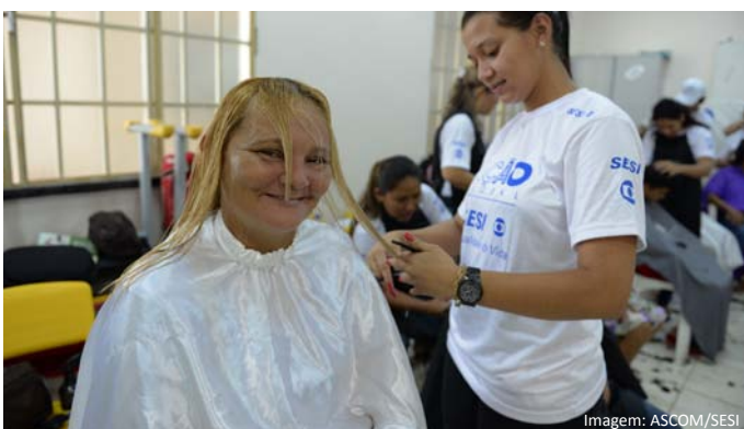
Corte de cabelo