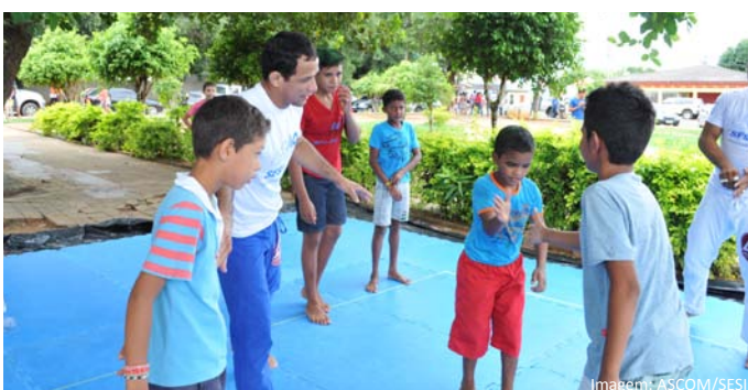
Aula de jiu jitsu