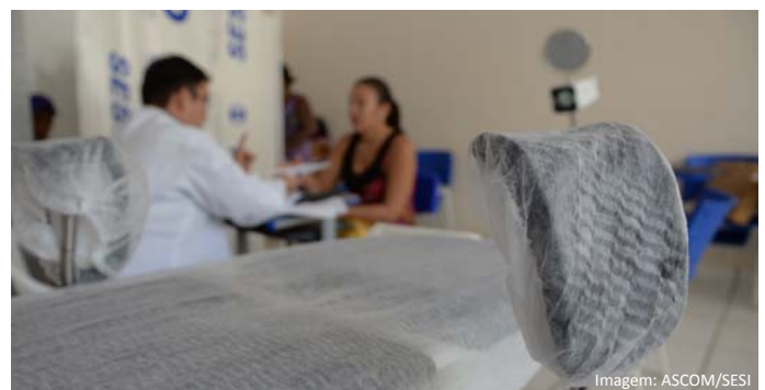
Preventivo do câncer de colo de útero