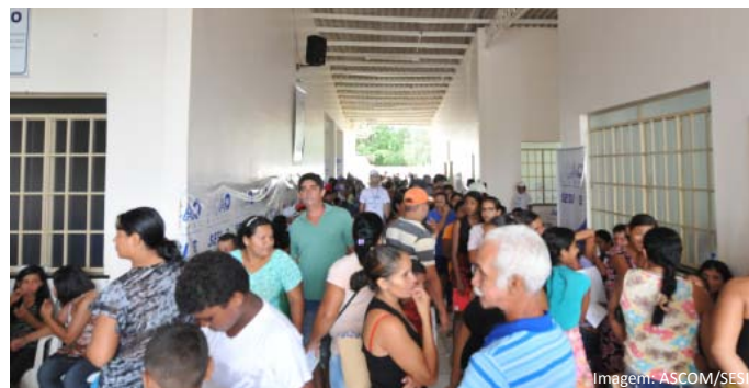
Ação Global recebeu moradores de vários interiores e vicinais