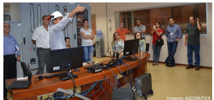
Conselho de consumidores durante visita na Termelétrica no Monte Cristo