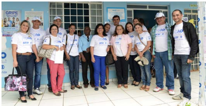
Superintendente do SESI acompanhada dos Coselheiros

O evento reuniu 2.956 pessoas e consolidou 8.868 mil atendimentos na 22ª edição do evento no município de Alto Alegre