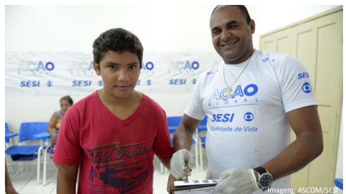
Emissão de carteira identidade