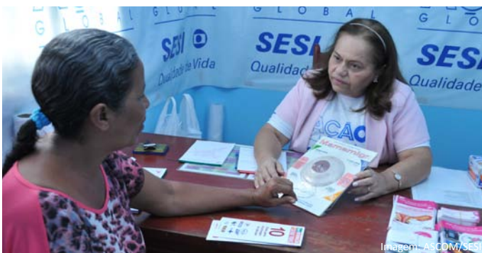
Exame clínico das mamas