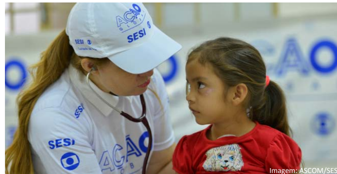
Ação Global recebeu moradores de vários interiores e vicinais

Com o tema “Qualidade de Vida”, a ação Global realizada pelo SESI e Rede Globo, no sábado dia 30 de maio, no município de Alto Alegre, foi um sucesso! A cidade que tem aproximadamente 16 mil habitantes, (IBGE/2014), teve um número significativo de moradores beneficiados com os serviços de saúde, educação, cidadania, voluntariado e recreação. Foram atendidas 2.956 pessoas que usufruíram de 8.868 atendimentos.