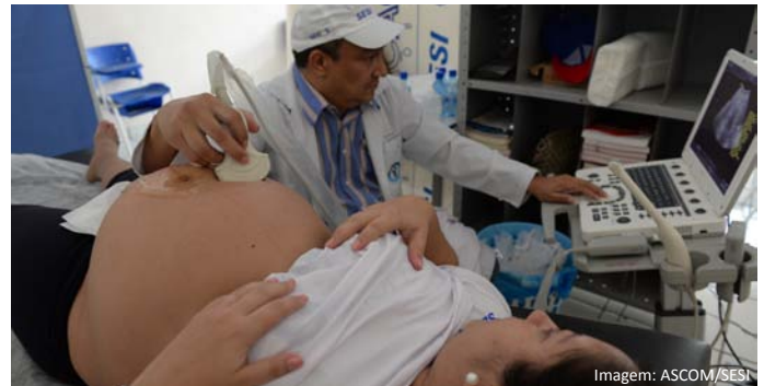
Ginecologia - exame de ultrassom