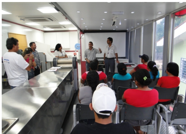
Atendimento nas unidades móveis do SENAI.