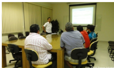
Membros do Sindigar e SindiJoias reunidos para a criação de polo mineral

Para a criação do pólo, será necessário no primeiro momento, estruturar as empresas cooperativadas que estão aptas a realizarem financiamento junto às instituições competentes (estima-se entre 10 e 15 empresas, segundo pesquisa do PROCOMPI/2013) e depois será necessário estruturar as demais empresas da Cooperativa,