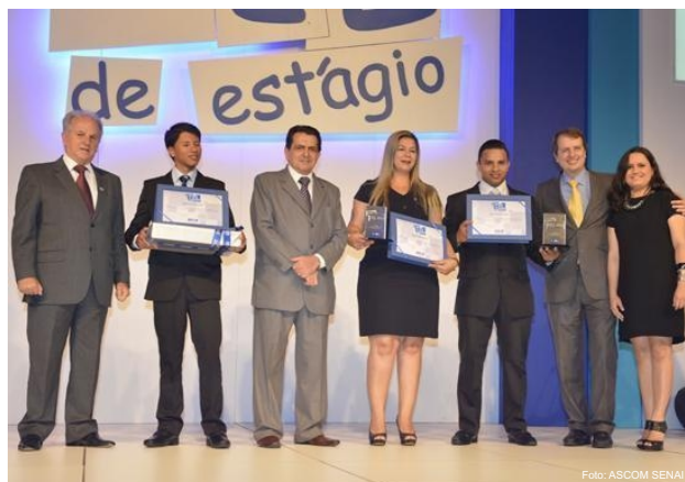
SENAI é agraciado com Prêmio IEL de Estágio

A solenidade aconteceu no Royal Tulip Hotel em Brasília e o SENAI/RR competiu na categoria Sistema Indústria ano 2013. O prêmio foi um reconhecimento ao desempenho do estagiário em suas atividades desenvolvidas dentro da empresa, incluindo comportamento, atendimento as normas e prática dos conhecimentos adquiridos na formação acadêmica, entre outras.