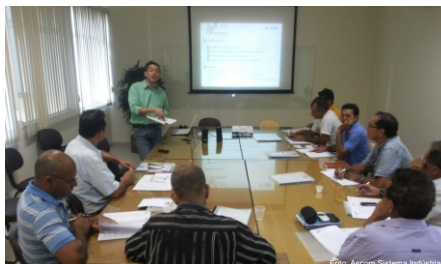
Dirigentes Sindicais debatem sobre planejamento estratégico