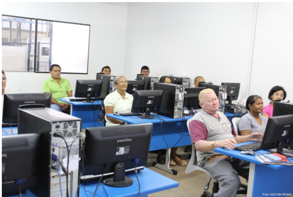
Pessoas com mais de 40 anos participam de cursos de informática