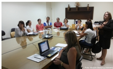
Coordenadores de unidades do SESI se reúnem para tratar sobre o planejamento estratégico 2015-2022

Na tarde desta terça-feira, (22) aconteceu na Federação das Indústrias de Roraima – FIER, a reunião de alinhamento da Rede de Planejamento Estratégico. O encontro é uma preparação para o Planejamento Estratégico Sistêmico 2015-2022 e serviu para compartilhar os resultados dos Cenários Nacionais, de acordo com pesquisa feita por uma empresa de consultoria contratada pelo BNDS e UFBA. A pesquisa vai nortear as áreas do SESI, SENAI e IEL, envolvidos na rede, no que diz respeito à elaboração das estratégias para o planejamento.