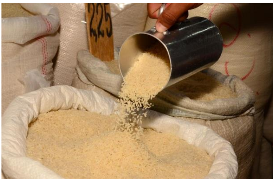
Arroz foi o produto mais exportado de Roraima. Com produção maior este ano, soja não teve destaque

Nos registros feitos pela Fier, o arroz foi o produto roraimense mais exportado durante 2018, com valor total de US$ 4.480.951, representando 28,08% da participação comercial. O setor madeireiro, que vem se recuperando após passar por uma queda significativa a partir de 2012, quando a crise financeira na Venezuela começou a ter mais expressividade, ficou em segundo, com 13,53% e US$ 2.158.844.