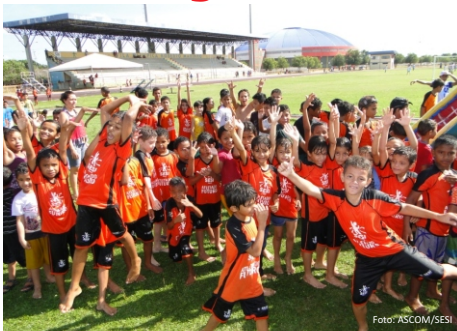
Aulas do PAF na Vila Olímpica Roberto Marinho

As equipes que irão atuar no programa serão formadas por acadêmicos de educação física e pedagogia. Eles foram capacitados ainda no mês de julho. Inicialmente serão 20 monitores, mas esse número pode chegar a 95, dependendo do aumento do quantitativo de participantes.