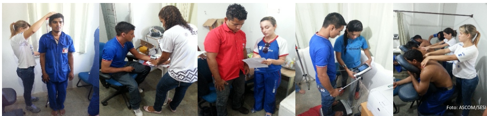
Colaboradores da Brasferro recebendo atendimentos na Semana de Vida Saudável

A Semana de Promoção da Vida Saudável, é promovida pelo SESI em todo Brasil. O projeto tem como foco o trabalhador da indústria e é uma forma de promover atividades preventivas e educativas com o objetivo de estimular a adoção de um estilo de vida mais saudável.