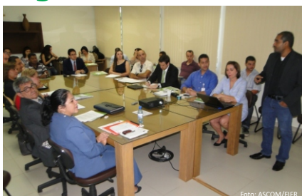
Representantes de instituições criam Fórum para gestão de resíduos sólidos

Na manhã da última terça-feira, 20, na sede da Federação das Indústrias do Estado de Roraima - FIER, foi instituído o Fórum Estadual Lixo e Cidadania Roraima - Reciclanorte, constituído por representantes de órgãos públicos, sociedade civil organizada, iniciativa privada e catadores da UNIRENDA (Cooperativa dos Amigos Catadores e Recicladores de Resíduos Sólidos).