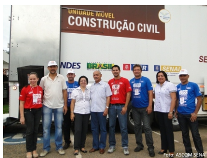
SENAI apresenta sua Unidade Móvel Construção Civil durante o DNCS

Tem capacidade para atender 19 alunos por turma e possui 214