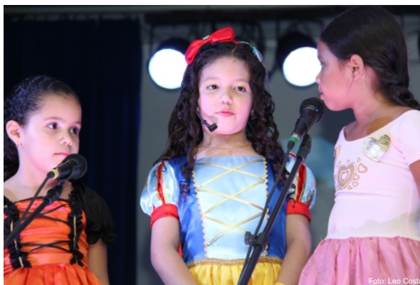
Alunos do Arte Jovem arrancam risos do público na 18ª Mostra SESI de Teatro

As crianças encantaram o público mostrando o seu talento nas peças “Branquinha de Neve”, “Sítio do Pica-pau Amarelo em: “Floresta Encantada”, “Irmãs para sempre”, “Os cinco mosqueteiros”, “Talvez encantadas”, “Os Semi Deuses”, “o Patinho quase bonito” e a “Caixa de Pândora”, todas adaptadas pelo professor Alex Zantelli, para a faixa etária de cada aluno.