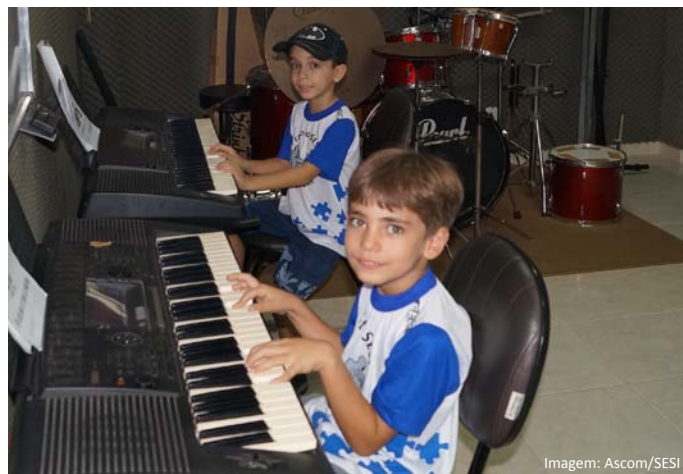
Alunos aprendendo a tocar teclado.

Já o Lazer Cultural oferece Musicalização com Teclado, Bateria, Violão, Prática de Banda e Teoria Musical. O Critério para fazer parte é ter 6 anos completos e disposição para aprender, ou seja, crianças, adolescentes, jovens, adultos e idosos podem se inscrever nesse projeto.