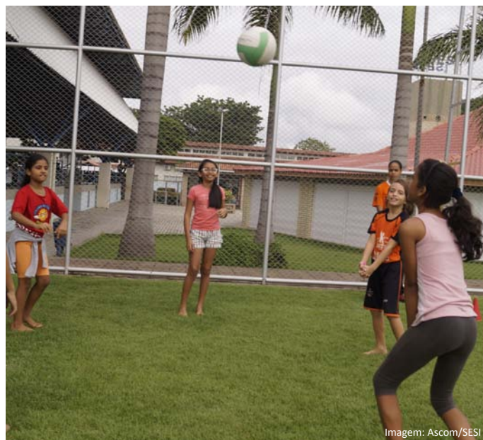
Crianças do projeto durante atividade recreativa

No mês de agosto serão realizadas as Avaliações Física e Atitudinal das crianças e dos adolescentes. A avaliação física é feita para mensurar o nível de força, resistência e coordenação motora, para, a partir do resultado, melhorar a capacidade física ao longo do programa. Já a Avaliação Atitudinal