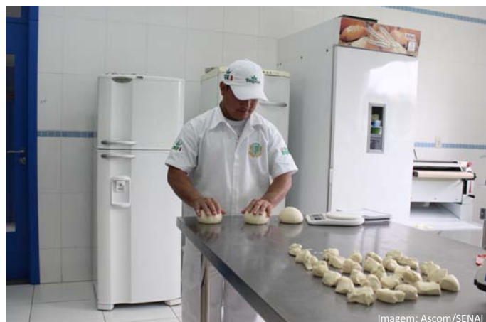
Técnico da Trigolar durante atividade no SENAI/RR