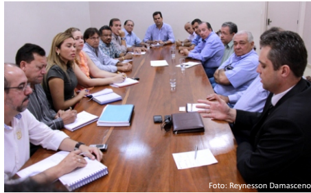
Vice Prefeito reunido com setor empresarial

Cadastro, após vistoria para que se possa calcular o pagamento da guia.