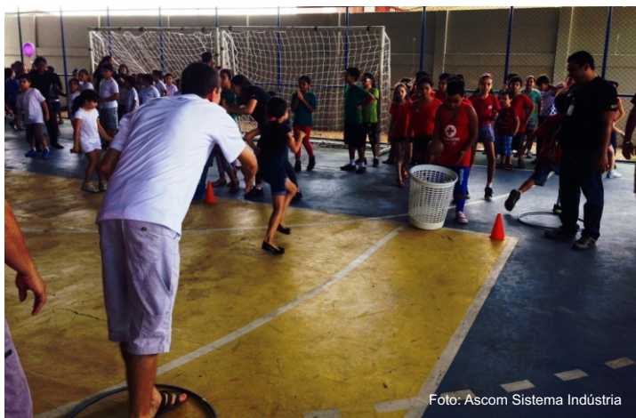
Alunos e familiares se divertiram na prova da bola ao cesto