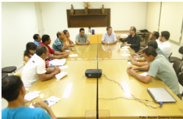
SINDIREPA promove reunião para falar sobre Licença Ambiental Federal

Após feito o registro junto ao órgão fiscalizador, será então emitida, mediante pagamento de uma taxa, a licença ambiental.