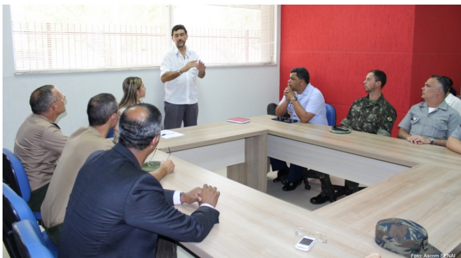
Comitativa das Forças Armadas